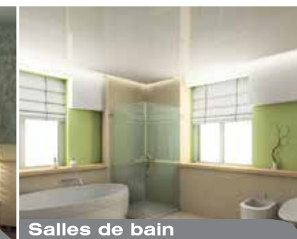
Salles de bain