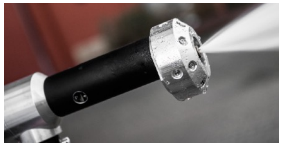
ARRIBA: BOQUILLAS / ABAJO: FOGGUN