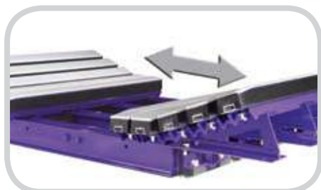
Cada mitad de la cama se separa para un fácil mantenimiento.