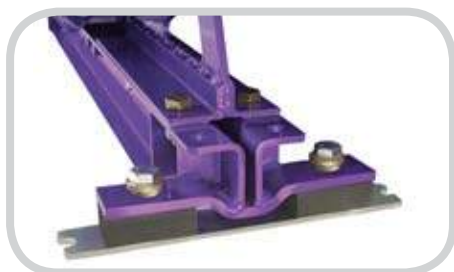
Los montajes de aislamiento proporcionan un segundo elemento que aligera el impacto.

Las camas de impacto DRX se dividen a la mitad, permitiendo que los dos lados se separen deslizándose. Esta característica única de Servicio de separación nos da un acceso directo a todas las barras y tornillos para un mantenimiento rápido, fácil y seguro. Las camas ofrecen un rápido cambio de una posición de marcha a una posición de servicio y viceversa. Otras camas requieren un equipo de dos personas y alrededor de ocho horas para reemplazar las barras. Con una cama DRX, el mismo equipo puede terminar un cambio de barras completo en un periodo de una a dos horas. Asimismo, la línea DRX está diseñada para trabajar con cualquier barra de impacto de hule común. Use los repuestos existentes y mantenga un inventario más pequeño para futuros cambios.