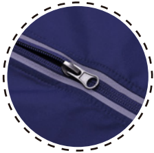
CINTA REFLECTANTE EN CIERRE