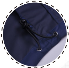
CORDÓN DE AJUSTE INTERIOR