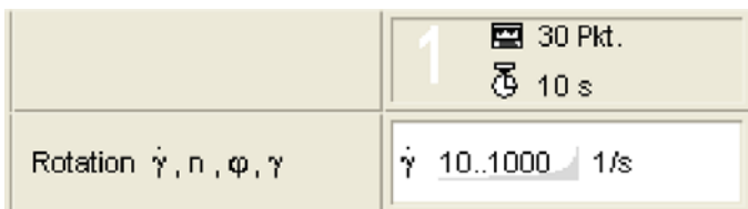
Fig. 2 El perfil de medición en el software Rheoplus TM

El perfil de medición en el software Rheoplus TM se compone de un intervalo.