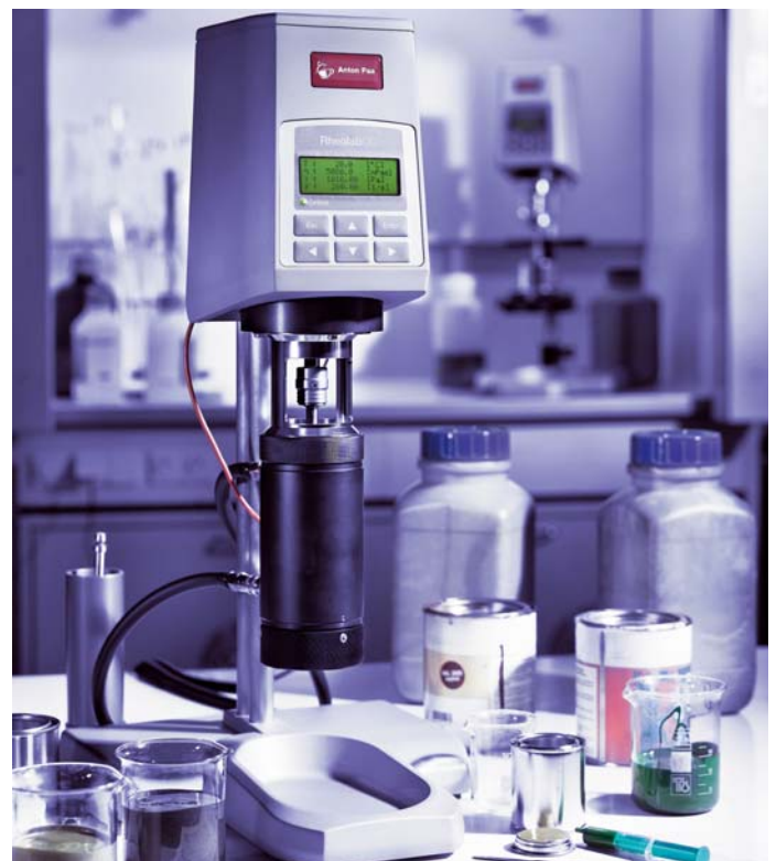
Fig. 1 El reómetro RheolabQC de Anton Paar

Esto define un estándar industrial para todo el gradiente de velocidad, independientemente de las dimensiones de los sistemas de medición de los diferentes fabricantes.