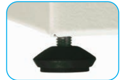
Pie elevador regulable