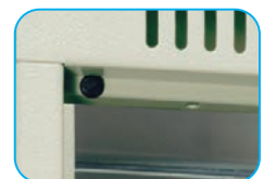
Refuerzo en puertas y tapón de goma