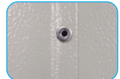
Remaches alojados para mejor acabado