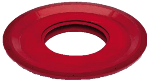
Sello de Doble Labio