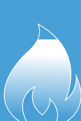
Costo energético actual