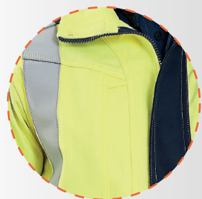
Bolsillo pectoral interior con tapeta más velcro y reflectante