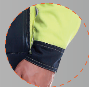
Puño con ajuste de velcro para mayor comodidad

LA LÍNEA UNISAFE 260 ES UNA PRENDA RETARDANTE A LA LLAMA CONTRA RIESGO DE QUEMADURA PRODUCIDA POR UN ARCO ELÉCTRICO. UNISAFE 260 OFRECE UNA MAYOR COMODIDAD Y MEJOR RESISTENCIA A LA PÉRDIDA DEL COLOR, ESTABILIDAD DEL TEJIDO Y DURABILIDAD.