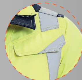
Bolsillos delanteros con cierres y cinta reflectante