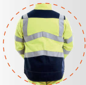
Espalda con cintas reflectantes para mayor visibilidad