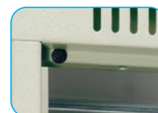
Refuerzo en puertas y tapón de goma