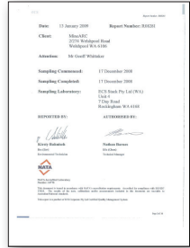
Ensayo de evaluación de riesgo en vivo para refugio MineARC® HRM