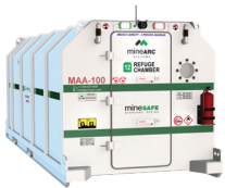
MS-SDE1-08-SIV-36 (8 Personas)

Algunas de las características de transporte especiales incluyen configuraciones angostas diseñadas a medida específicamente para operaciones en piques, o construcciones modulares que permiten desmontar la cámara de refugio en secciones más pequeñas antes de su transporte para su posterior montaje bajo tierra.