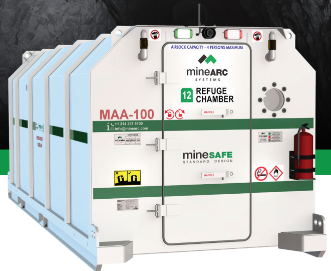
MineSAFE Diseño Estándar cámara de refugio (MS-SDE2-12-SIV-36)

Ofrece configuraciones estándar de acuerdo a la cantidad de ocupantes, de 8 a 30 personas, y cada modelo está diseñado para ofrecer la máxima resistencia y maniobrabilidad tanto en superficie como bajo tierra.