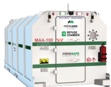
MS-SDE3-16-SIV-36 (16 Personas)