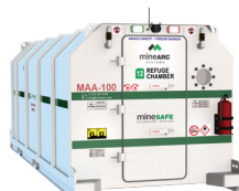
MS-SDE4-20-SIV-36 (20 Personas)