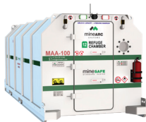
MS-SDE2-12-SIV-36 (12 Personas)