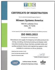
TRC ISO 9001: 2015, sistemas de gestión de calidad