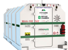
MS-SDE5-26-SIV-36 (26 Personas)