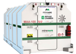
MS-SDE6-30-SIV-36 (30 Personas)