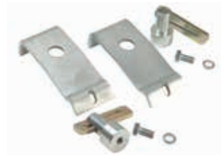
PAL PAK atornillable

*Incluye dos clavijas sujetadoras atornillables y dos placas de abrazaderas.