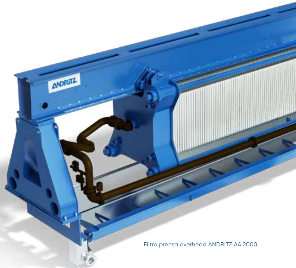
Filtro prensa overhead ANDRITZ A4 2000