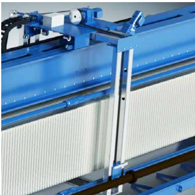
Dispositivo de lavado para operaciones totalmente automáticas