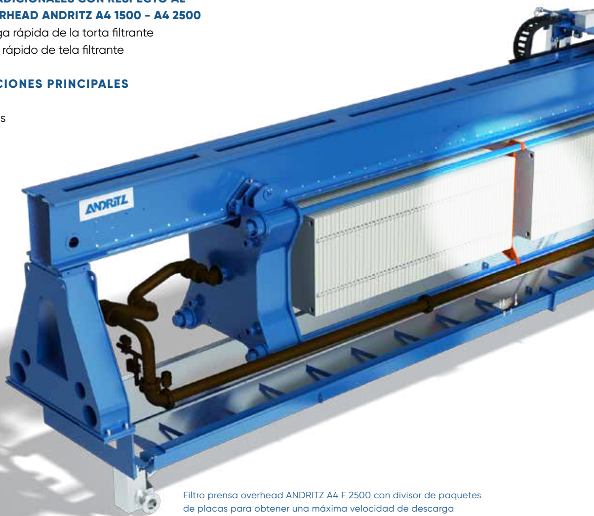
Filtro prensa overhead ANDRITZ A4 F 2500 con divisor de paquetes de placas para obtener una máxima velocidad de descarga