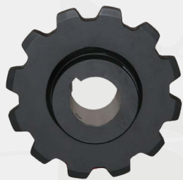
Diente tipo transportador