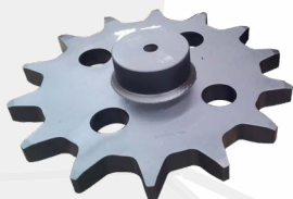
Diente tipo motriz