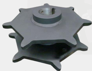
Sprocket para tratamiento de aguas residuales