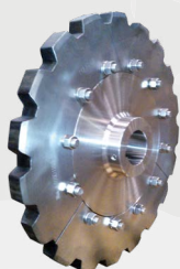
Sprocket de acero inoxidable