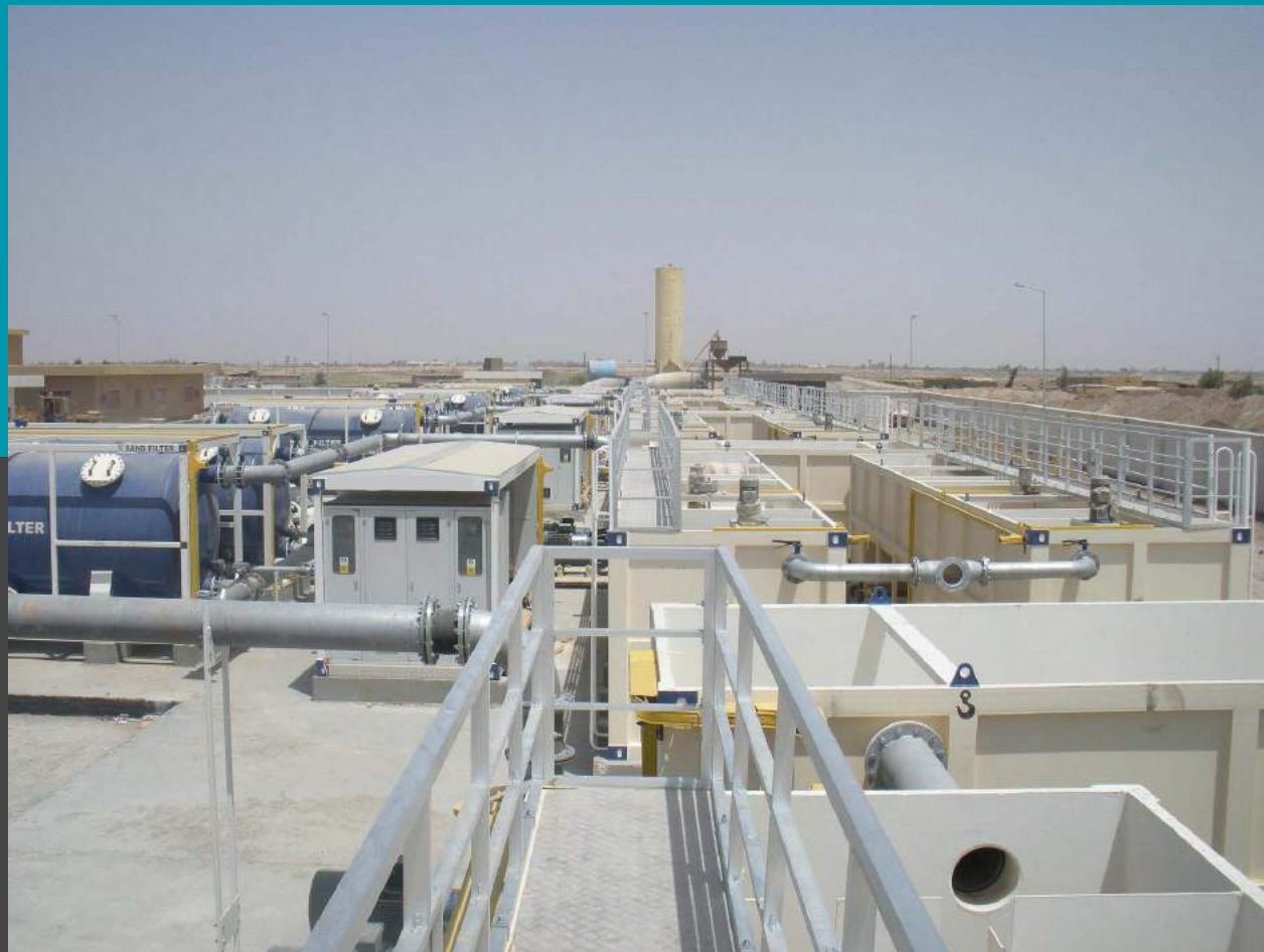
W.T. Unidad compacta - Caudal 2 x 400 m 3 /h Floculación, clarificación y filtración Sección