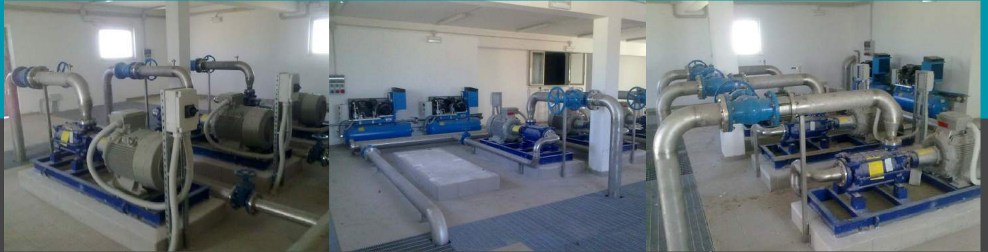
Estación de bombeo Caudal de 2000 mc/día Agua potable