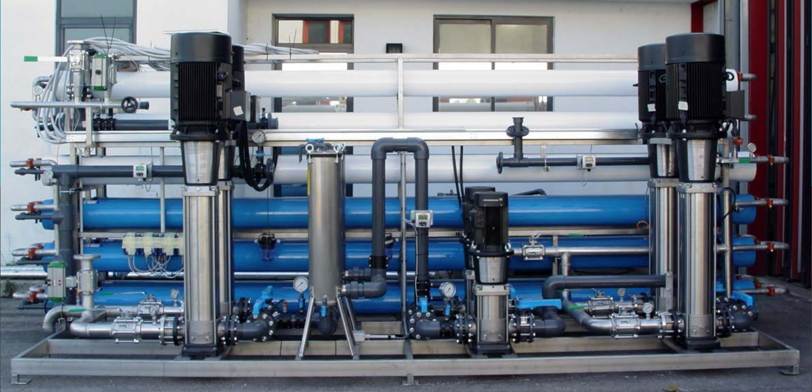
La ósmosis en doble paso planta de desmineralización Mod. BWD 790 Caudal 33 mc/h - la alimentación de la turbina de vapor