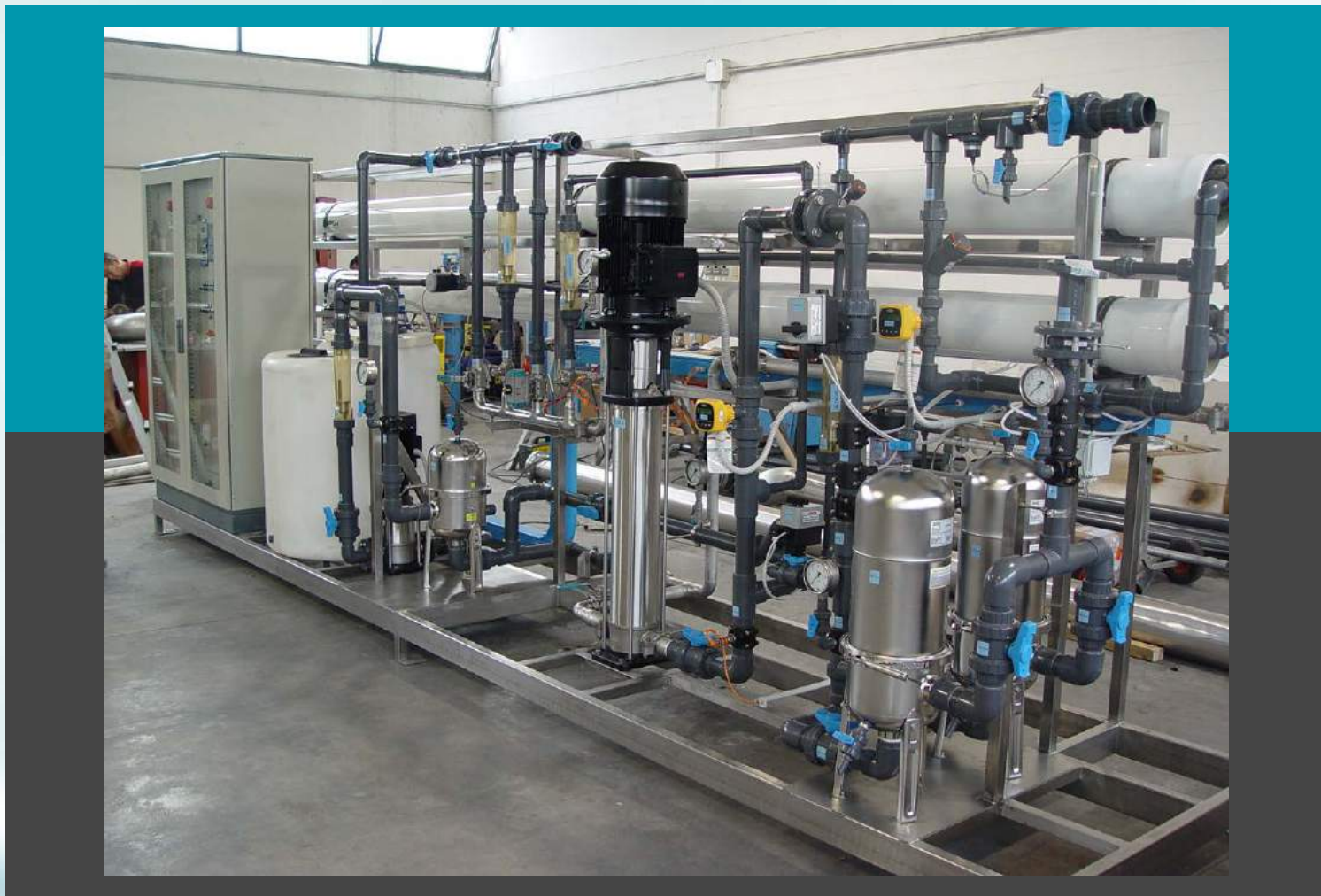
Planta de ósmosis inversa - Caudal de 350 mc/día refinación y recuperación de residuos industriales