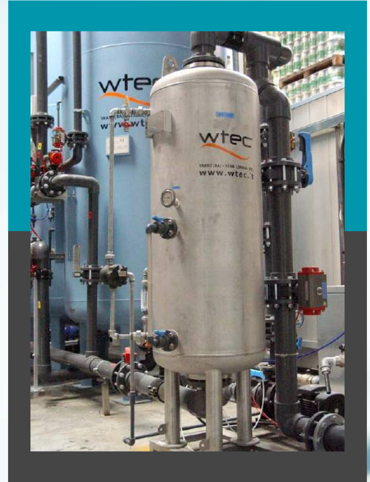
Oxidante del aire Mod. OX155 - Caudal 50 mc/h