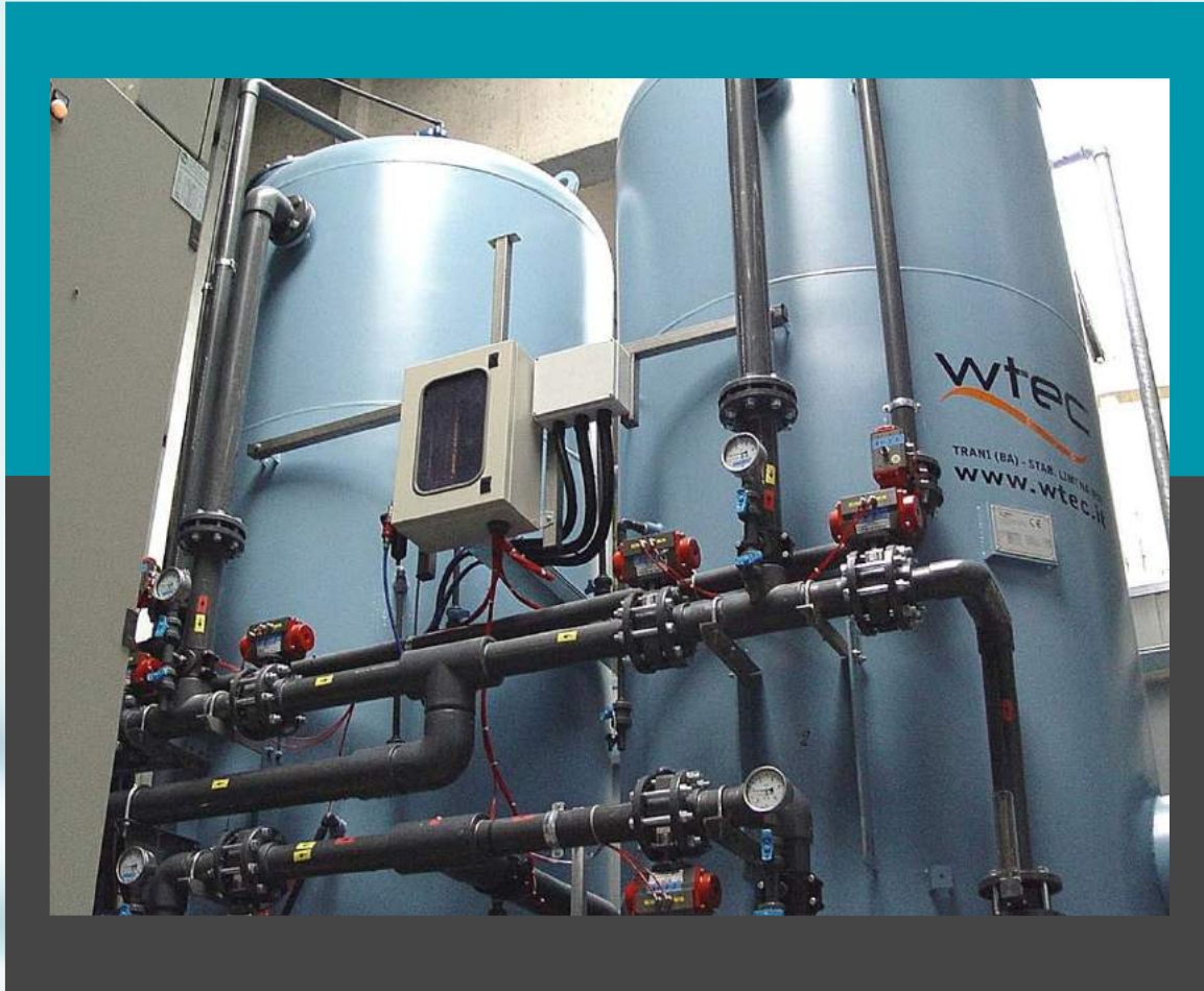
Biológica rapido apresión filtros FAB 150 - Caudal 2x25 mc/h