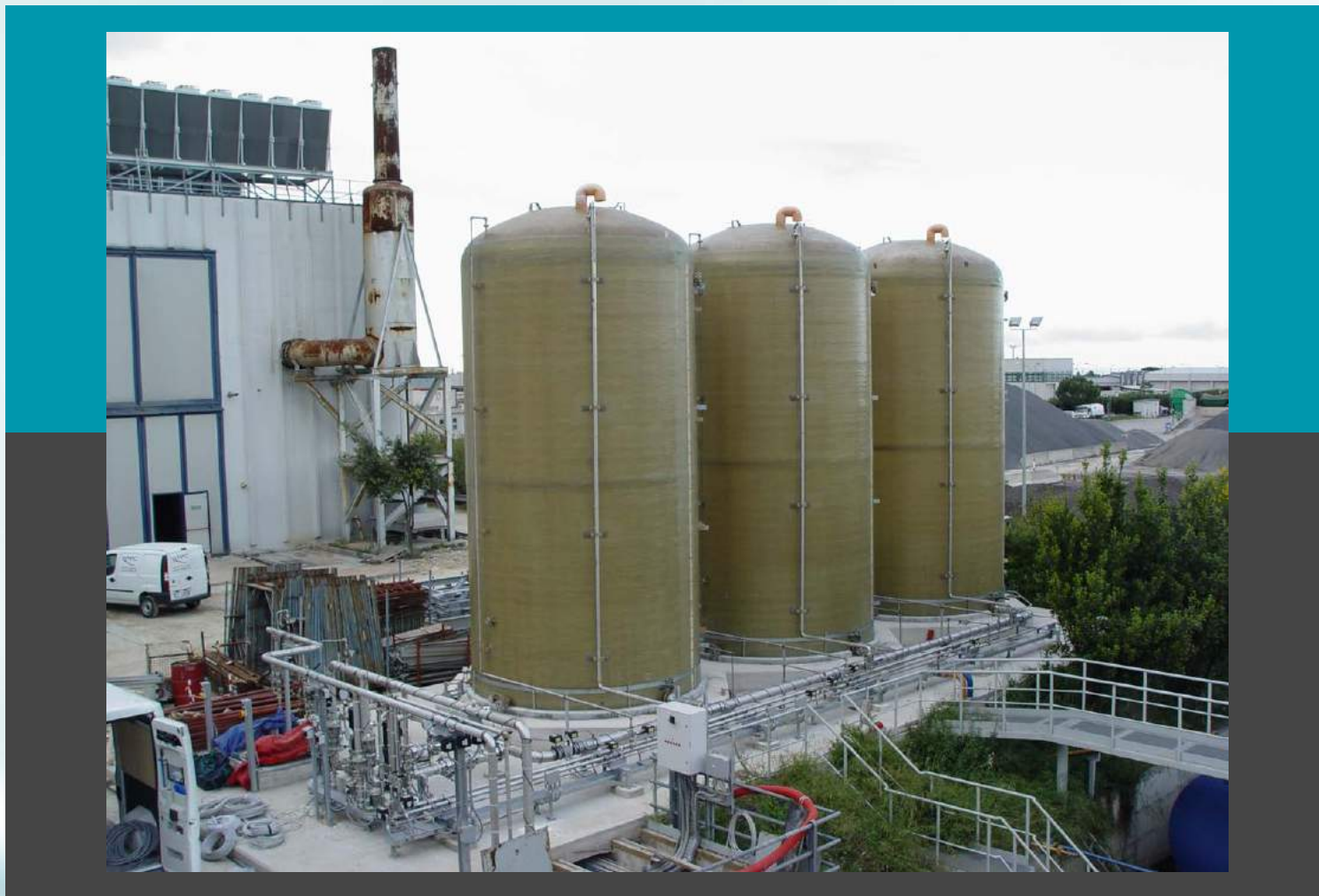
El tratamiento del vapor condensado desde el generador de vapor Planta de Polishing – Caudal máximo de 180 m 3 /h