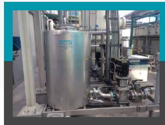
El tratamiento del vapor condensado desde el generador de vapor Planta de Polishing – Caudal máximo de 180 m 3 /h