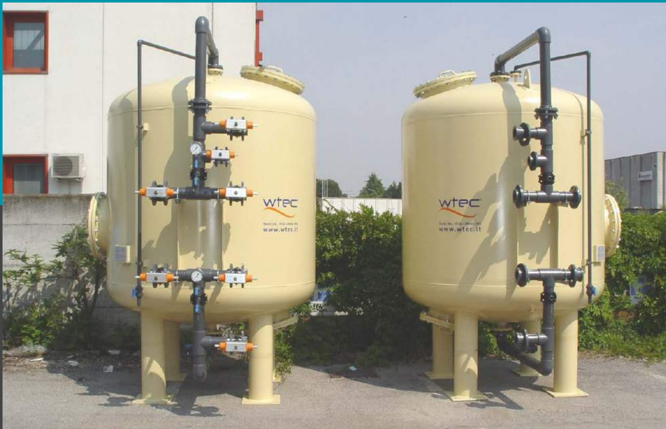
Planta de Suavizantes Duplex Mod. ISD 2400 - Caudal 35 mc/h