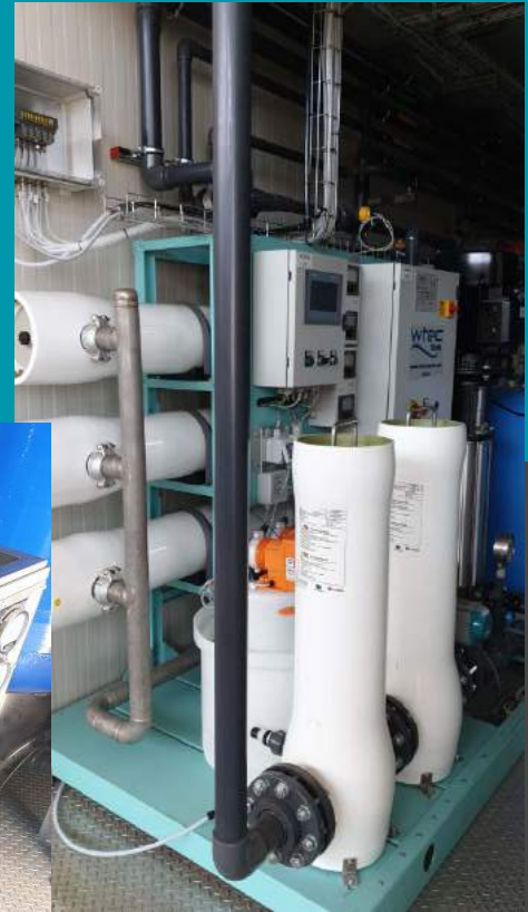
Planta de ósmosis inversa + EDI: caudal de 200 mc/día producción de agua demi a <0,2 \mu\text{S/cm}