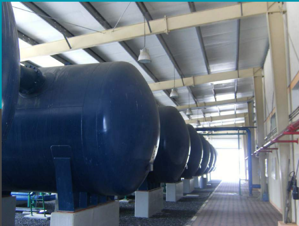
Filtros de presión rápida horizontales de multimedia con placa de boquillas n ° 8 FAS DFO 235 caudal de 8 x 185 mc/h