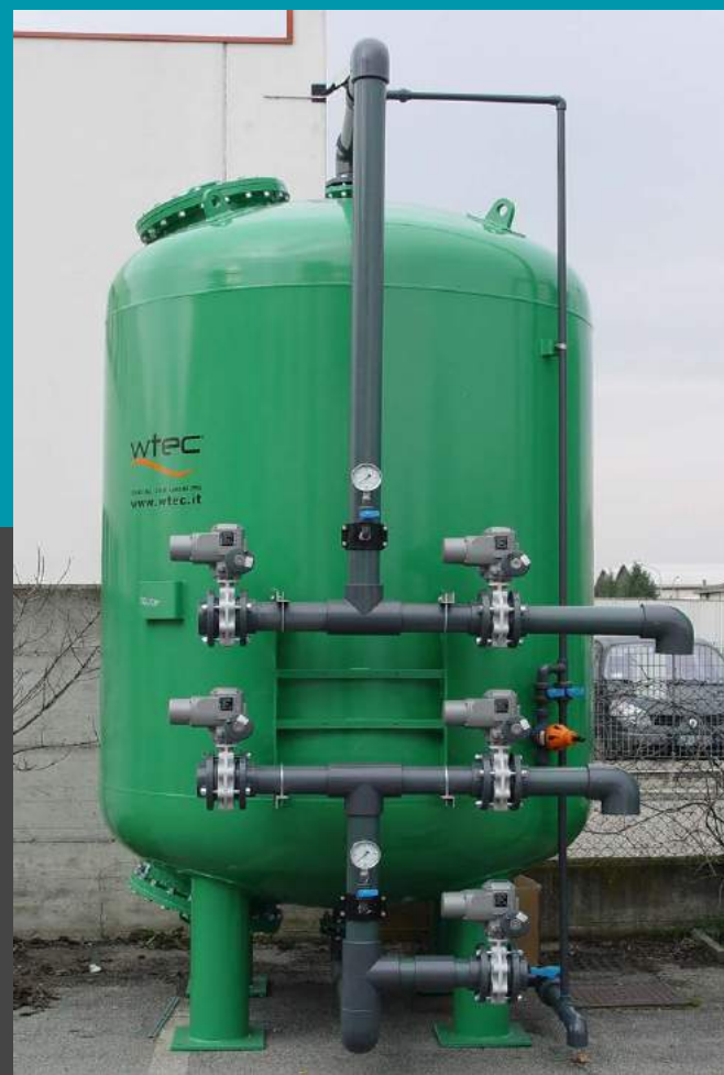
filtro FAC 200 rápido de presión a carbón activado con la placa de boquillas el flujo 47 mc/h