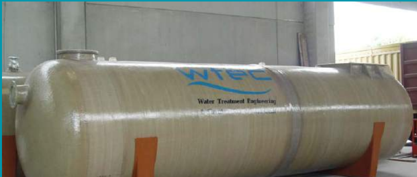
PLANTA MODULAR DE TRATAMIENTO DE AGUAS RESIDUALES