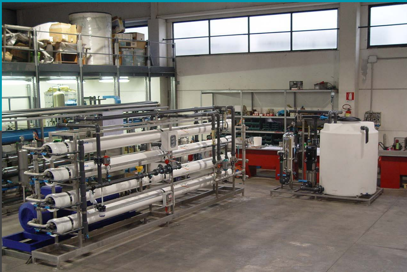
Planta de desmineralización, planta de ósmosis Inversa Mod. BWD 300 - Caudal de 12,5 mc/h