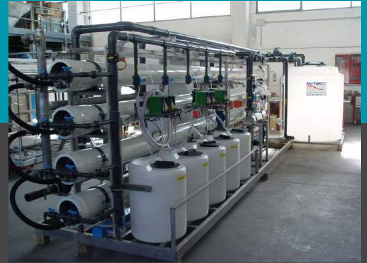
Planta de potabilización, Planta de desalinización por agua de mar de ósmosis inversa - Mod. SW 300 - Caudal de 300 mc/día