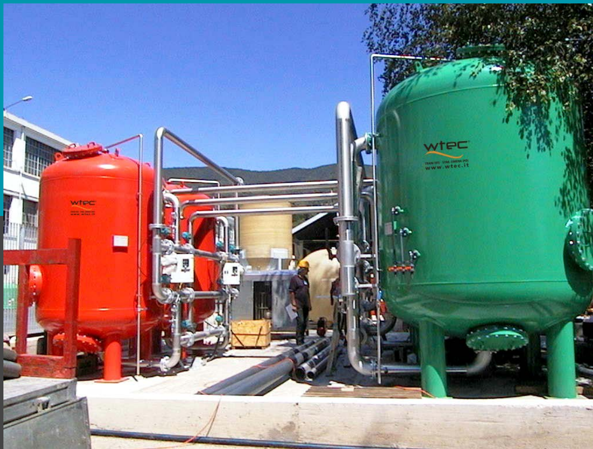
Filtros rápidos de presión con placa de boquillas: Desferrización filtra FAD 180 + filtros FMC 250 de carbón activado en la rotación de funcionamiento, El flujo 2 \times 25,4 + 2 \times 73,6 mc/h