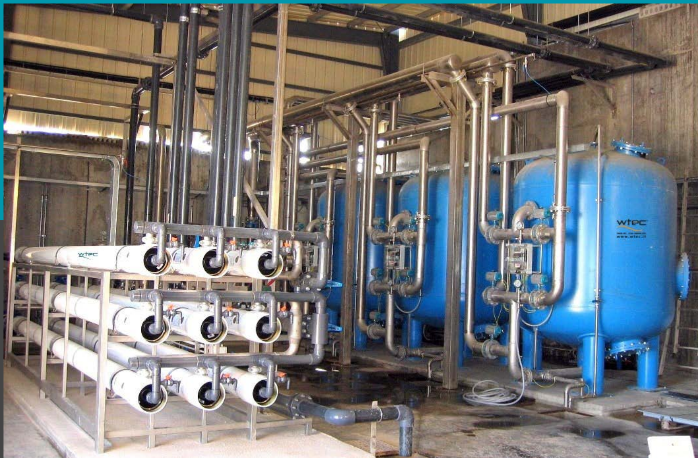
Planta de desmineralización, planta de ósmosis inversa Mod. BWD 1300 - Caudal 2x53 mc/h Con un tratamiento previo: n° 3 de presión rápida filtra FAS 220 - proceso de fabricación de papel de la industria