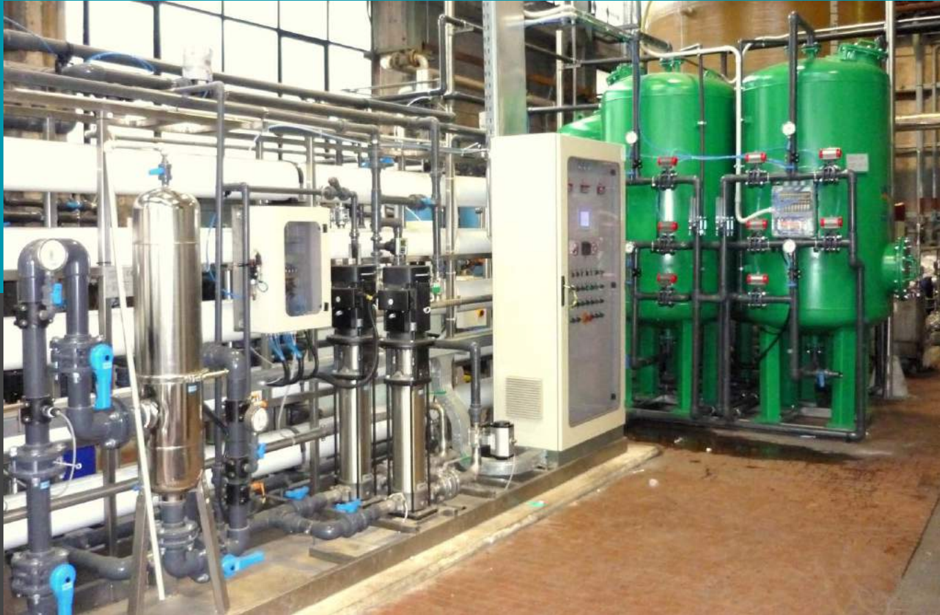
Planta de desmineralización, planta de ósmosis inversa en doble fase con pretratamiento Mod. BWD 300 - Caudal de 12,5 mc/h - la alimentación de la turbina de vapor