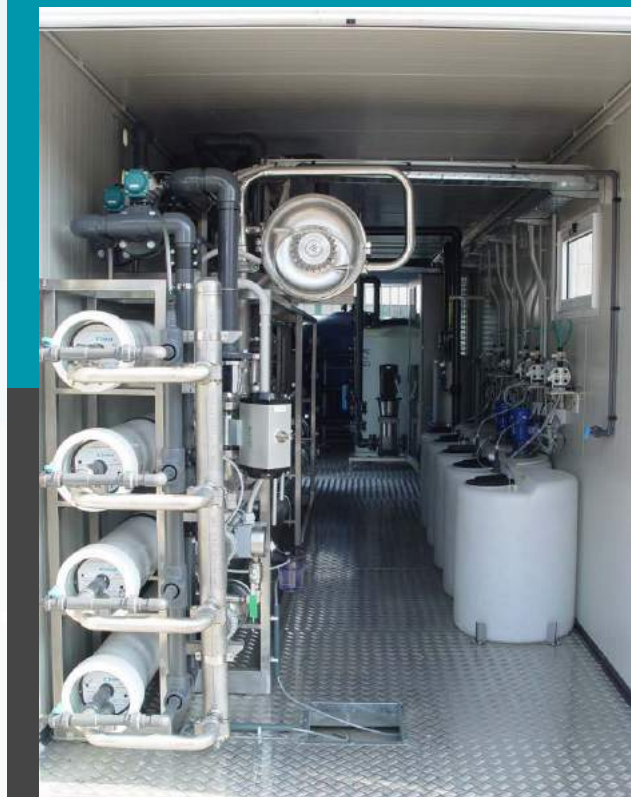
Planta de potabilización Planta de ósmosis inversa en container Mod. SW 320 Caudal 13 mc/h