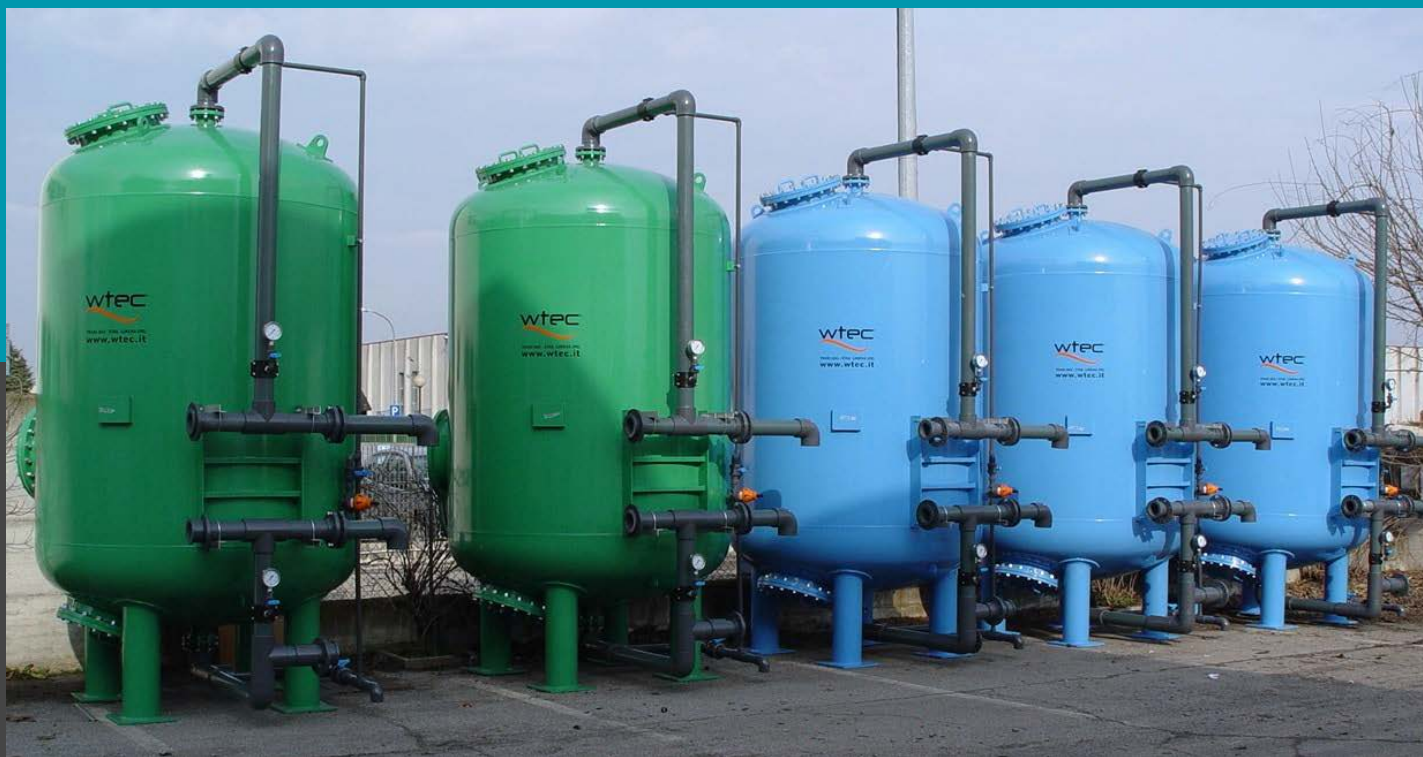
Filtros rápidos de presión con placa de boquillas: Filtros de multimedia FAS 200 + filtros de carbón activado FAC 200 el flujo 3x47 + 2x47 mc/h