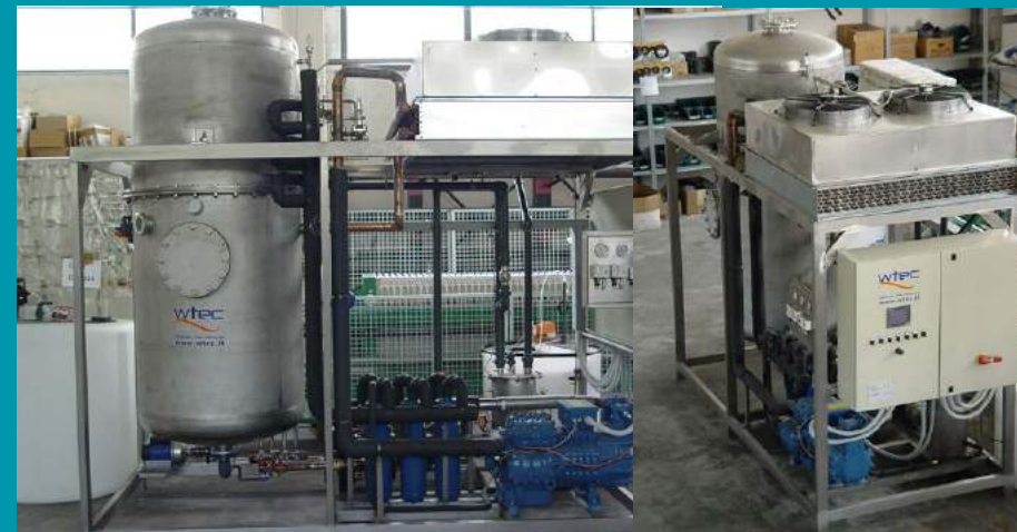
Caudal 6 mc/día