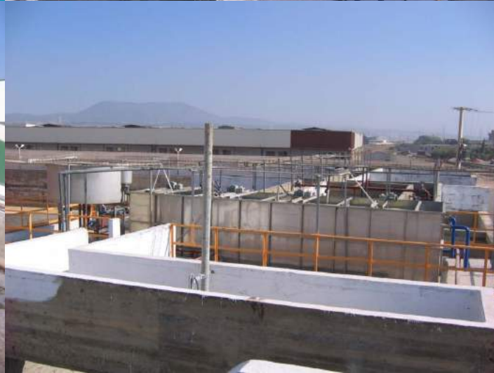
Planta Químico / físico - biológico Caudal de 360 mc/día por aguas residuales de las refinерías de aceite vegetal