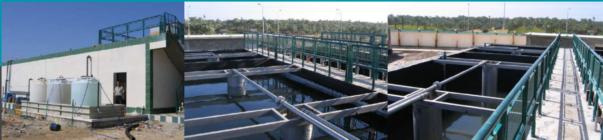
Planta de clarifloculador de residuos industriales Caudal de 1000 mc/día Planta de tratamiento de agua de campos de la perforación de petróleo