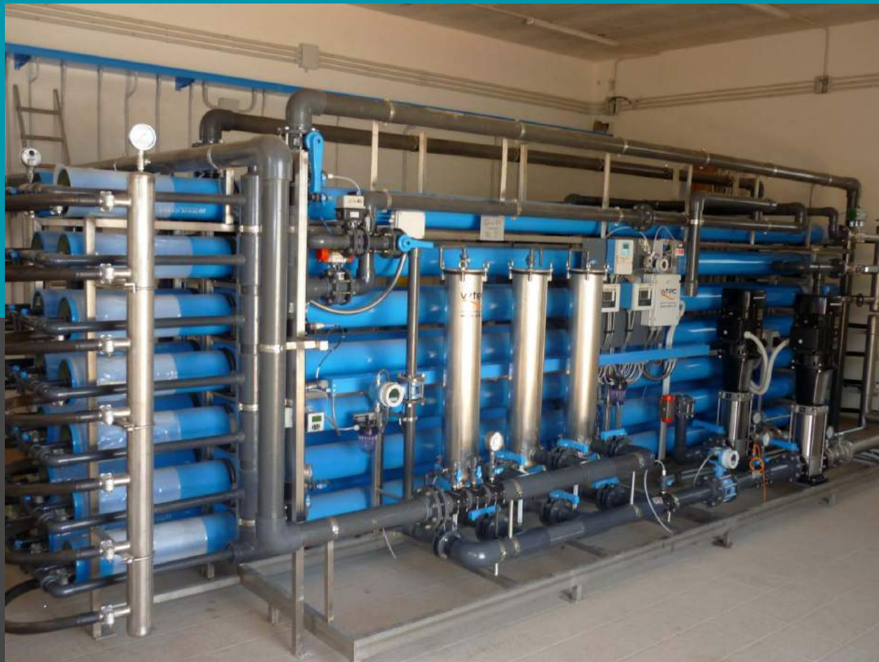
Planta de potabilización, planta de ósmosis inversa Mod. BWP 1320 - Caudal 2 x 55 mc/h