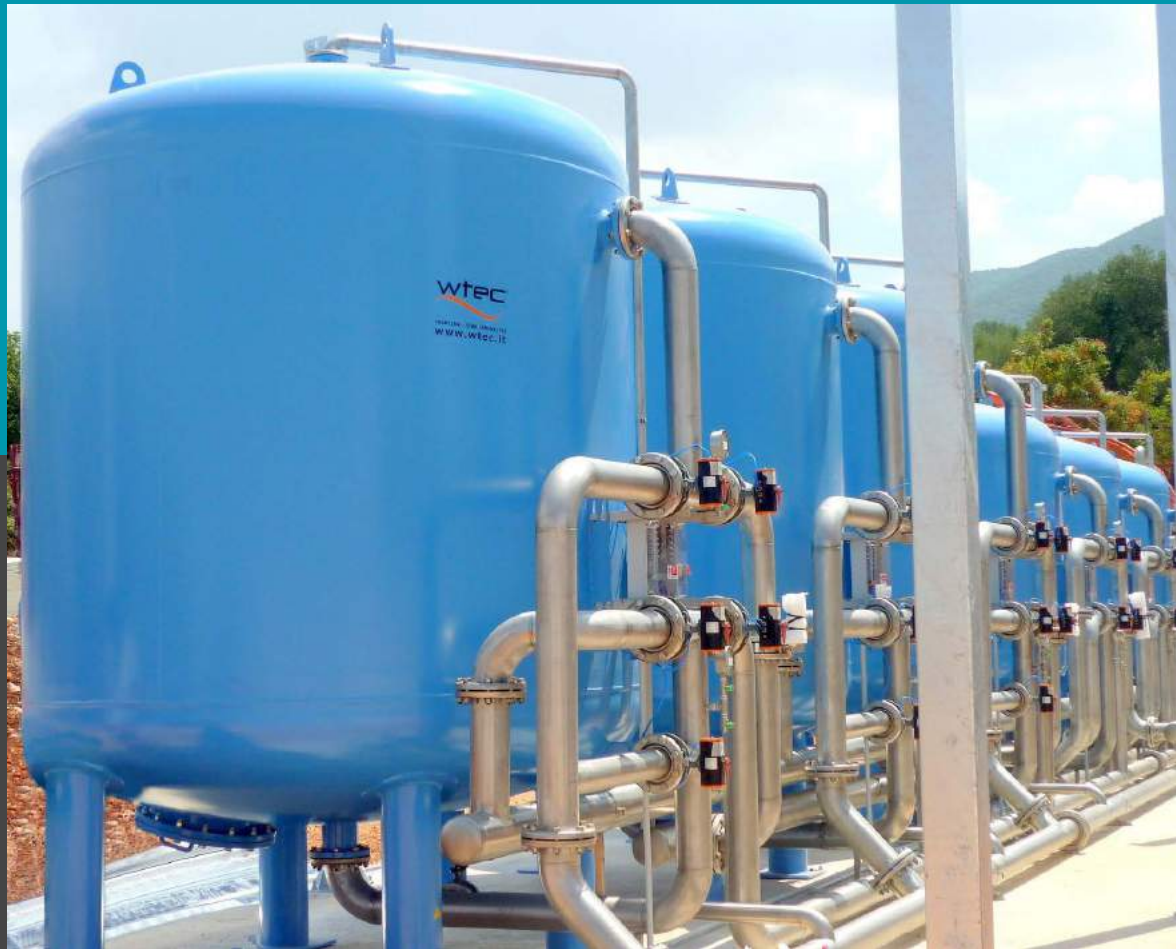
Filtros de presión rápidos multi medios con placa de boquillas n° 3 FAS/R 250 + n° 3 FAC/R 250 - Flujo de 3x50 mc/h