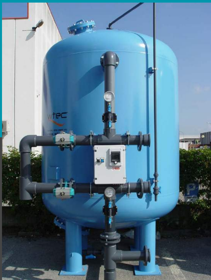
Filtro FAS 200 rápido de presión multimedia con placa de boquillas el flujo 47 mc/h