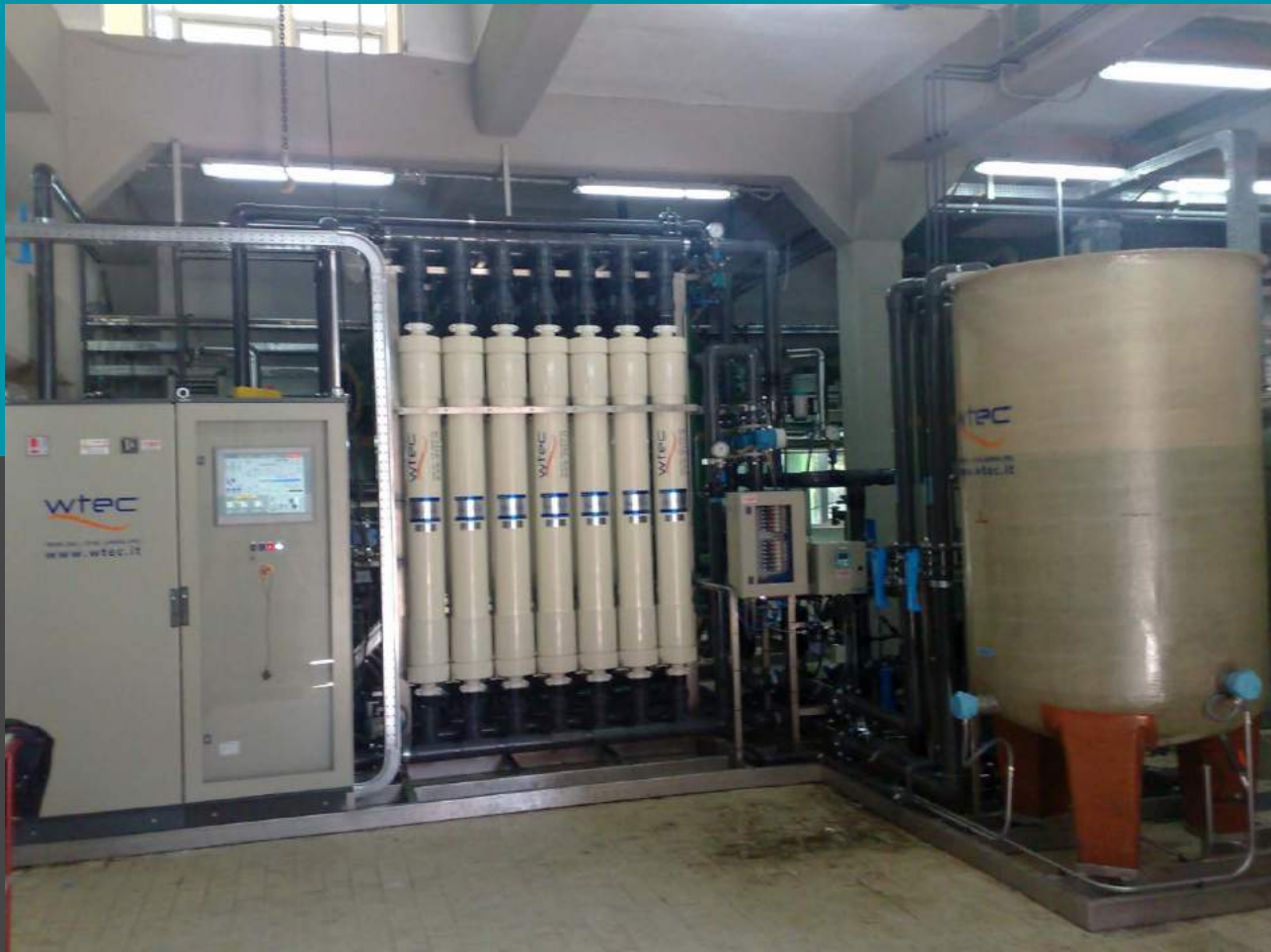
Planta de ultrafiltración con membranas de fibra hueca de PVDF - Caudal de 36 mc/h Pretratamiento a la ósmosis inversa