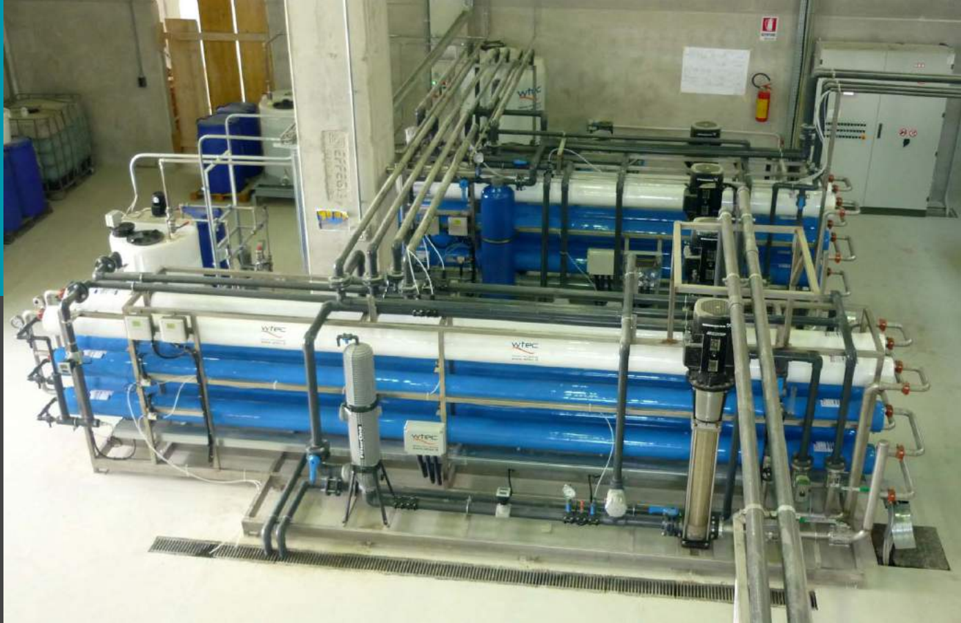
Planta de desmineralización, planta de ósmosis inversa en doble fase con pretratamiento Mod. BWD 375 - Caudal de 2x15,6 mc/h la alimentación de la turbina de vapor