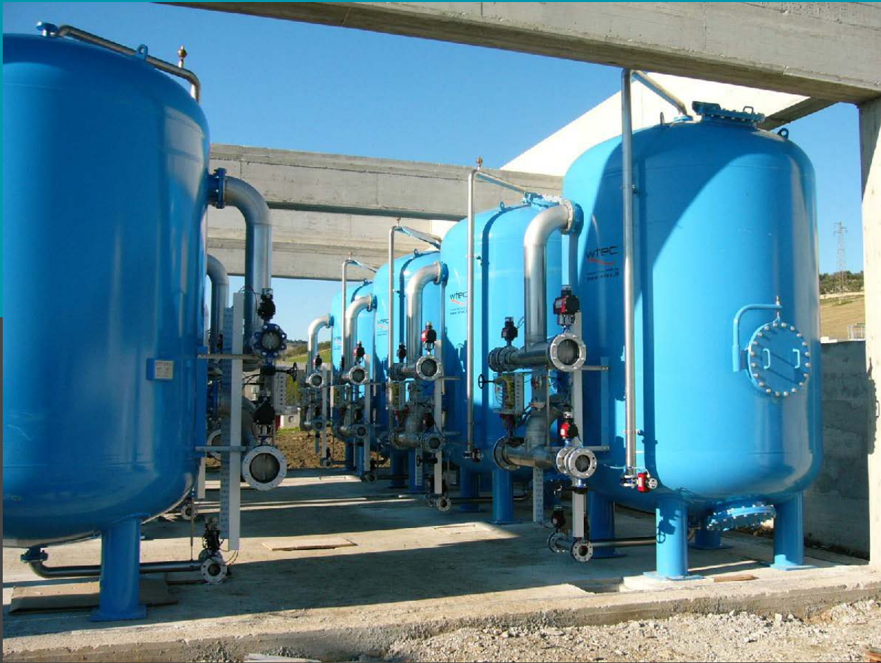
Filtros de presión rápida FAS/R 250 soporte dual con la placa de boquillas Flujo de 8 x 75 mc/h - Planta de tratamiento terciario de aguas residuales