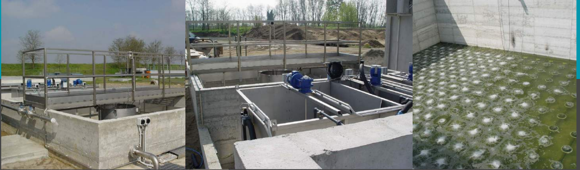
Planta de aguas residuales industriales Caudal de 200 mc/h Especial de aguas residuales biológica y - Tratamiento físico químico