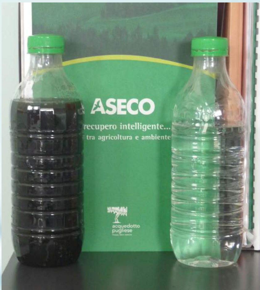
Agua antes y después del tratamiento de concentración