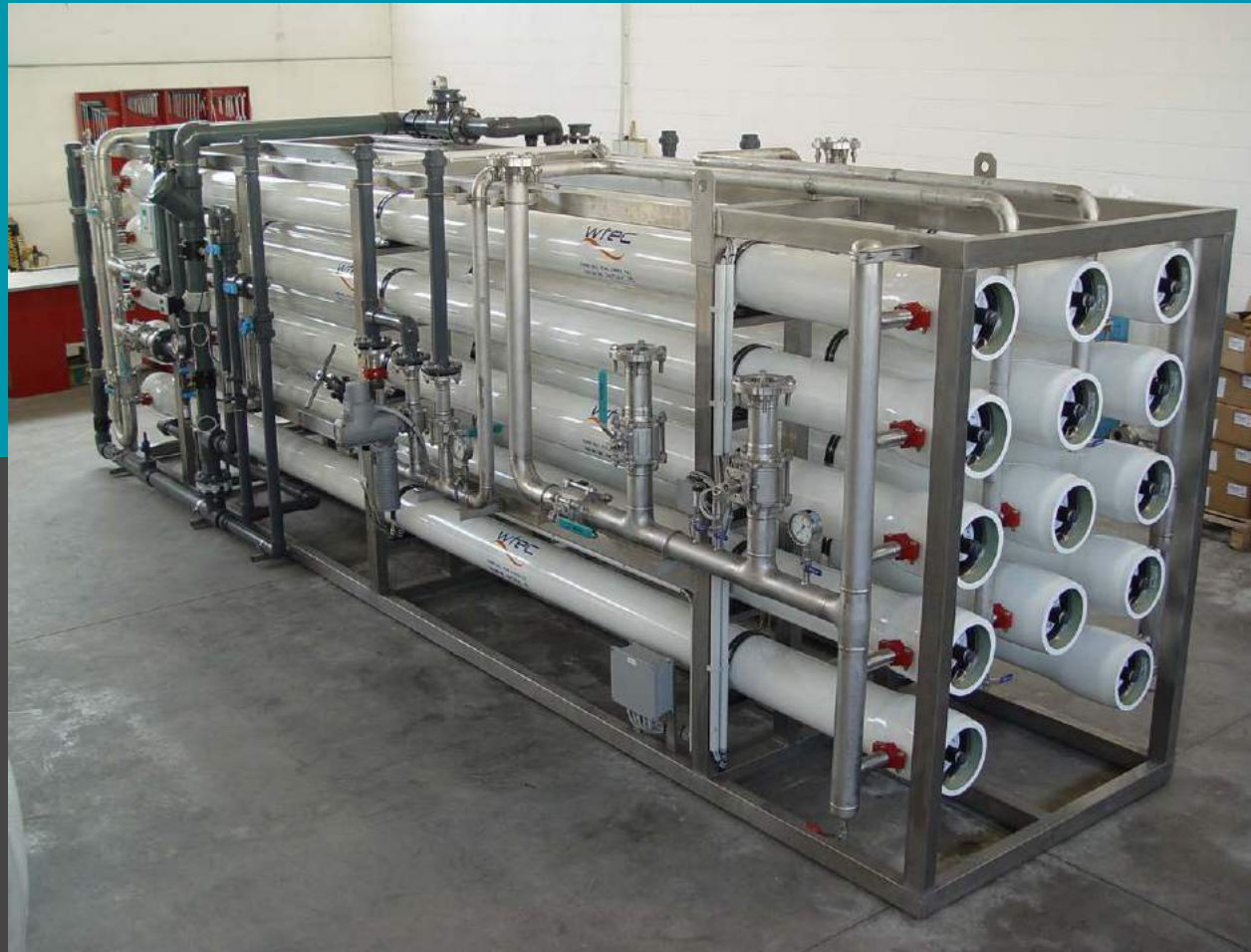
Rack de desalinización de ósmosis inversa