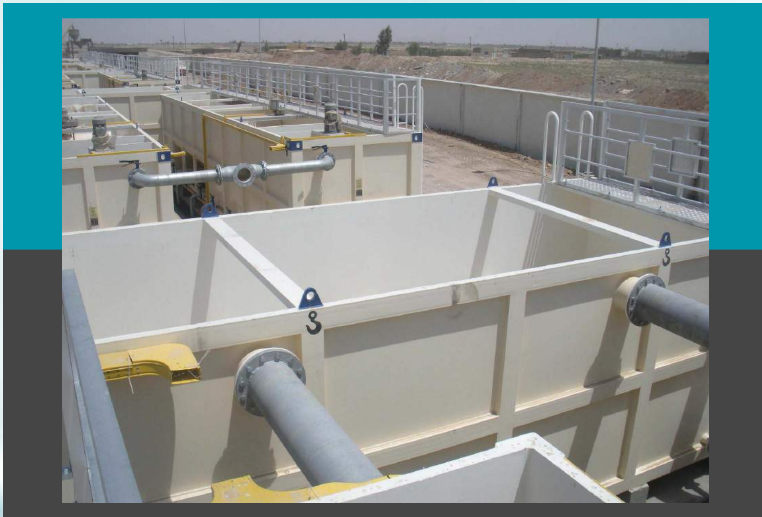
W.T. Unidad compacta - Caudal 2 \times 400 \text{ m}^3/\text{h} - Tanque de floculación y la Sección Preliminar