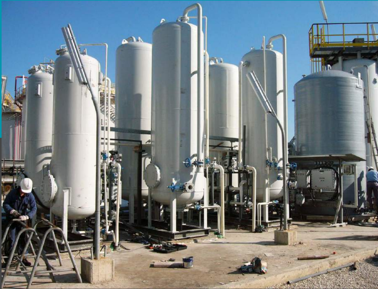
Planta compuesta por n° 2 filtros de doble medio que trabajan en paralelo y filtros de carbón activado n° 2 (primera y segunda unidad de acabado más áspero) que trabajan en paralelo, Flow 2 x 10 mc/h