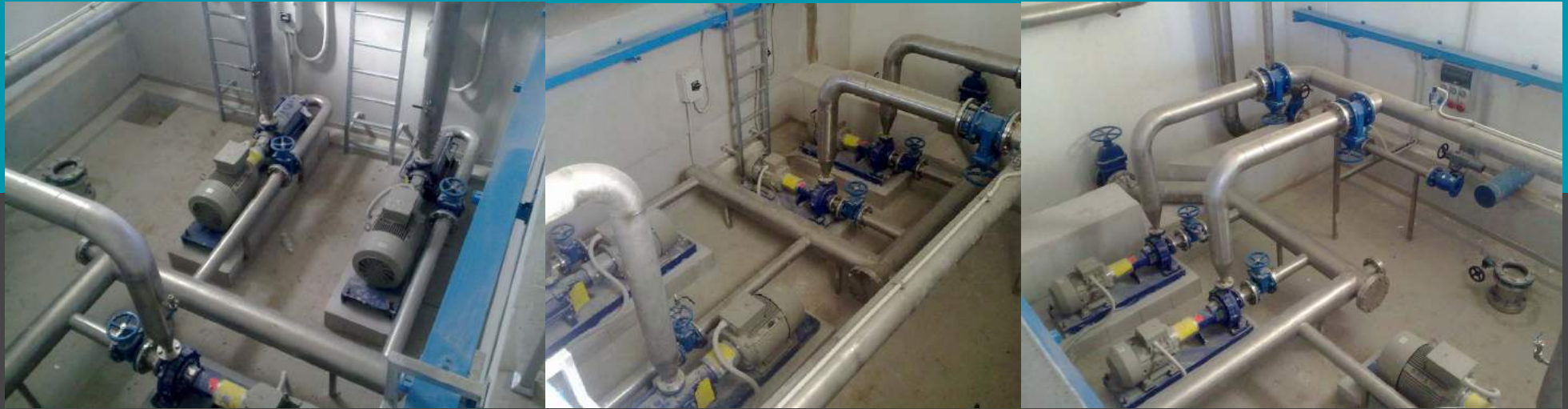
Estación de bombeo Caudal de 600 mc/día Agua potable