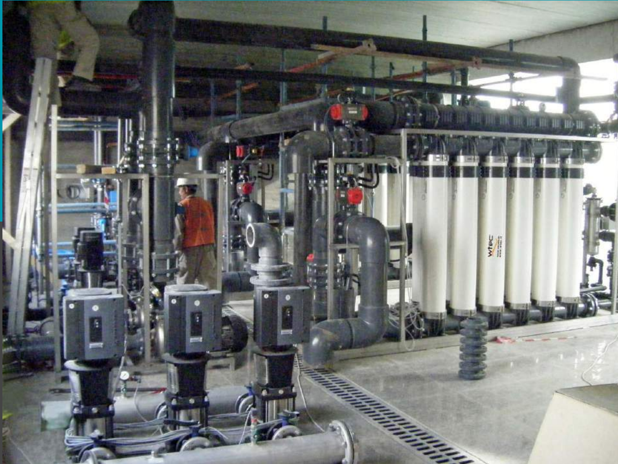
Planta de ultrafiltración con membranas de fibra hueca de PES - Caudal de 2x40 mc/h Refinación de aguas residuales y la reutilización