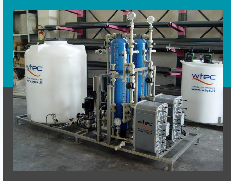
Plantas EDI Refinación de agua desmineralizada agua de alimentación para la turbina de vapor