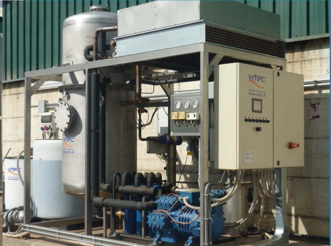
Caudal 8 mc/día