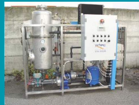
Caudal 0,25 mc/día

La planta está llena de un tanque de almacenamiento para el agua a tratar y de un tanque de neutralización