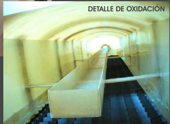
DETALLE DE OXIDACIÓN