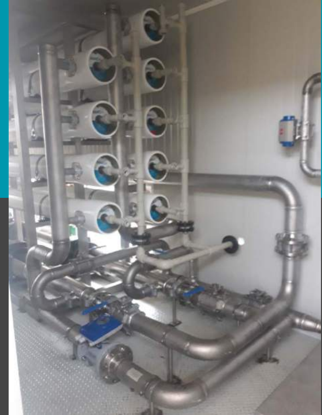
Planta de ultrafiltración y ósmosis inversa – caudal 540 mc/día Refinación del agua de la plataforma de purificación industrial para su reutilización.