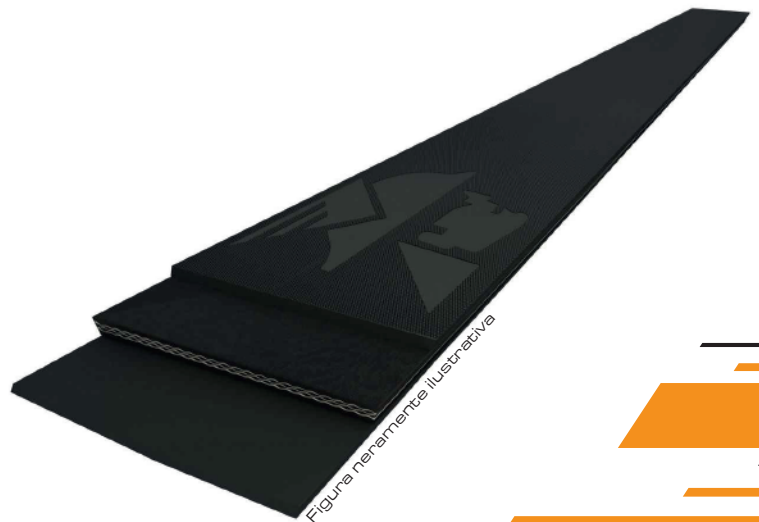
Figura meramente ilustrativa

*Datos sujetos a alteración sin aviso previo.