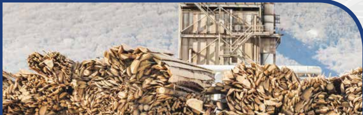
Productos de Madera