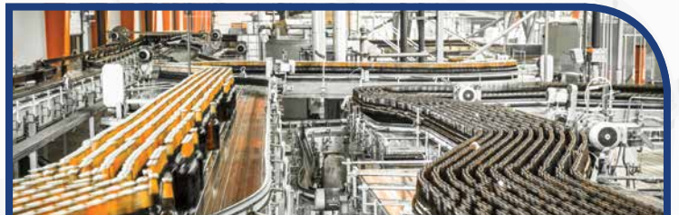
Alimentos y Bebidas