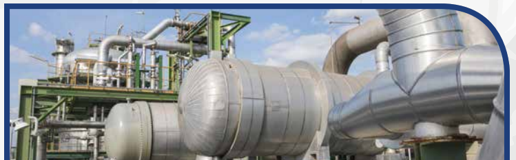
Intercambio de Calor y Enfriamiento por Aire