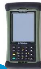
4 TRANSMITTER CONTROLLER