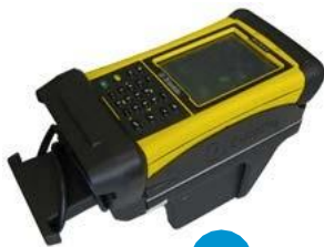
2 ENCODER CONTROLLER