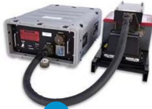
3 FIRE SYSTEM TRANSMITTER