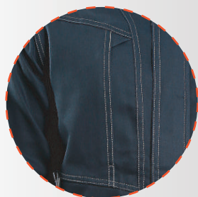
Bolsillo con cierre