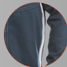
Bolsillos delanteros con cierres y cinta reflectante