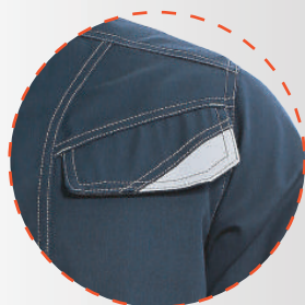
Bolsillo pectoral interior con tapeta más velcro y reflectante