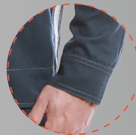
Puño con ajuste de velcro para mayor comodidad