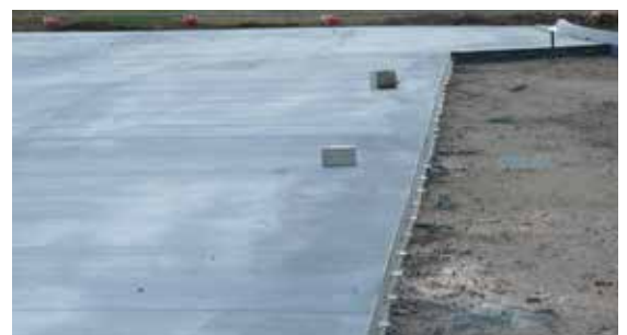
Juntas de control