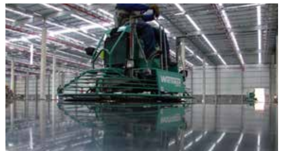
Técnicas de acabado