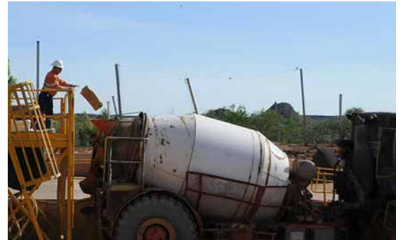
Cargando y Mezclando

Como las fibras BarChip se mezclan homogéneamente en todo el concreto, observará algunas fibras en la superficie durante la colocación, consolidación y nivelación. Utilizando técnicas de acabado estándar, estas fibras se incorporan fácilmente de nuevo a la superficie de la losa, lo que les permite actuar como protección frontal contra las grietas que se inician en la superficie.