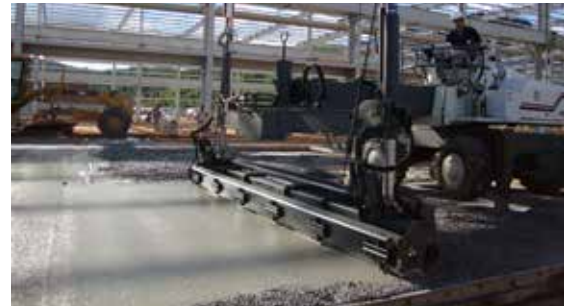
Técnicas de acabado

El curado apropiado del concreto es esencial cuando se buscan los resultados óptimos de rendimiento. Curar es proteger el concreto tanto del secado rápido como del enfriamiento rápido. Esto se puede lograr con acumulación de agua superficial o la aplicación de una sistemas patentados que incluyen cubiertas y compuestos aplicados. Si el concreto no se cura adecuadamente, se pueden formar grietas incontroladas incluso cuando se proporcionan juntas cuidadosamente detalladas.