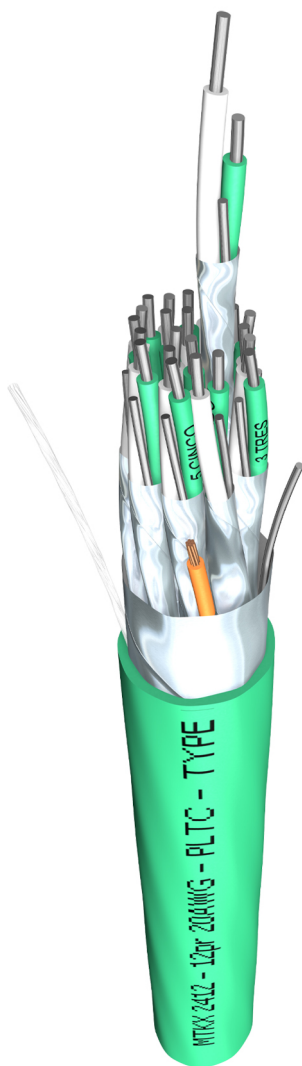
MT ARTEMP® Multipar blindado Norma IEC