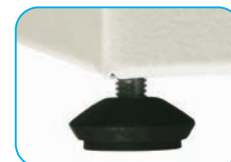
Pie elevador regulable