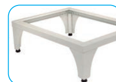
Base elevadora (opcional)