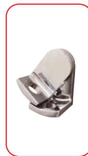
Cierre porta candado