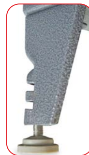
Patas con regatones ajustables