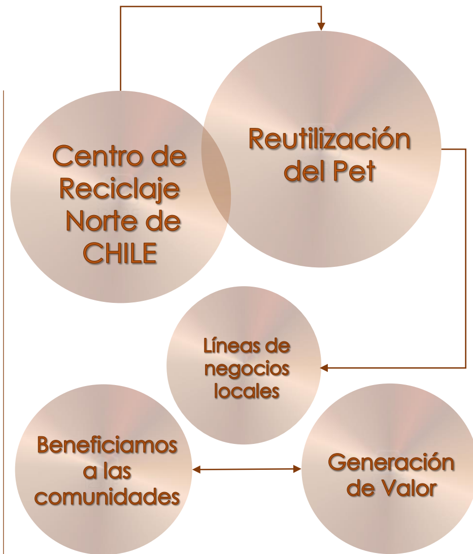
FASE 2 2023