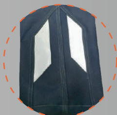
Diseño innovador en pierna más reflectante

LA LÍNEA UNISAFE 260 ES UNA PRENDA RETARDANTE A LA LLAMA CONTRA RIESGO DE QUEMADURA PRODUCIDA POR UN ARCO ELÉCTRICO. UNISAFE 260 OFRECE UNA MAYOR COMODIDAD Y MEJOR RESISTENCIA A LA PÉRDIDA DEL COLOR, ESTABILIDAD DEL TEJIDO Y DURABILIDAD.