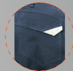
Bolsillo trasero con tapeta más velcro