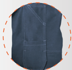
Bolsillo múltiple costado derecho