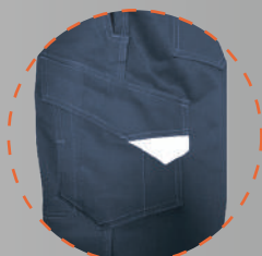
Bolsillo costado izquierdo con tapeta más velcro