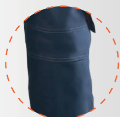
Refuerzo en rodillas mas bolsillo con tapeta y velcro