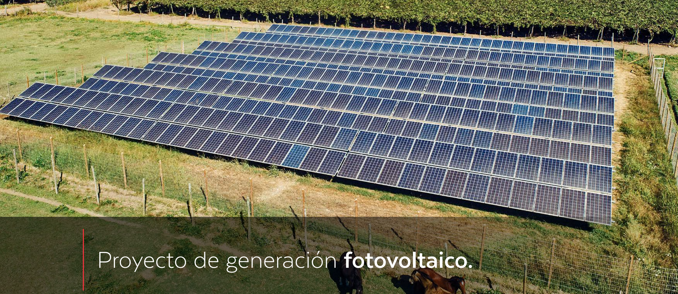
Proyecto de generación fotovoltaico.

LÍDER EN EL SUMINISTRO DE SOLUCIONES ENERGÉTICAS.