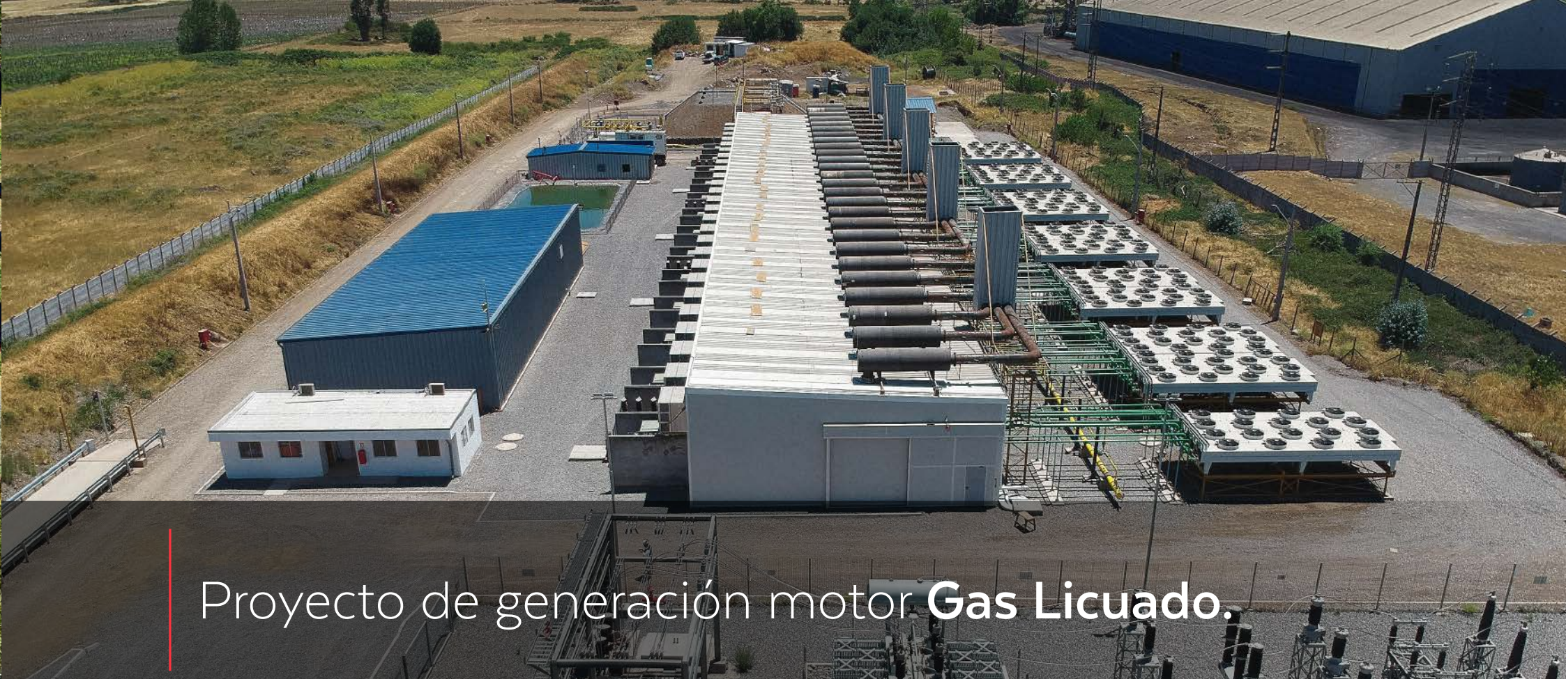
Proyecto de generación motor Gas Licuado.