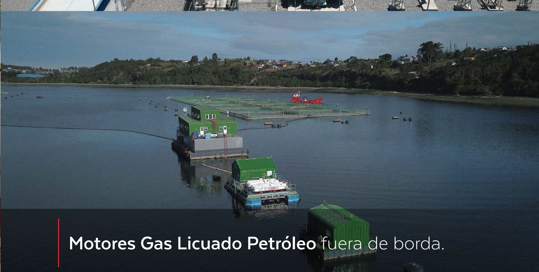
Motores Gas Licuado Petróleo fuera de borda.