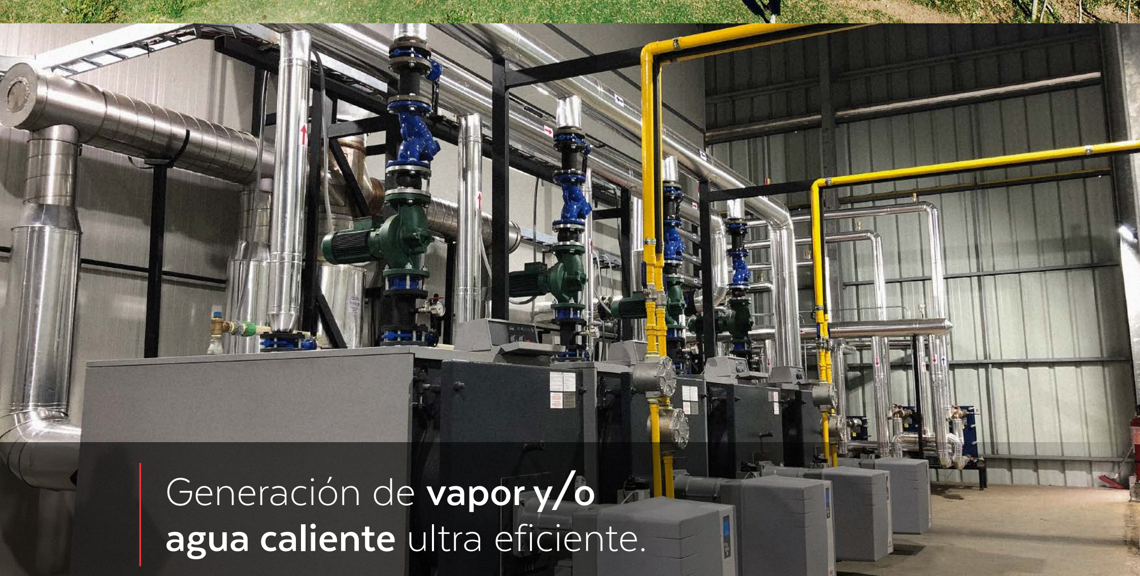
Generación de vapor y/o agua caliente ultra eficiente.