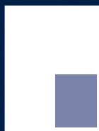
1/4 Página Vertical 8,5 x 12,2 cm