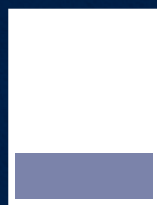
1/4 Página Horizontal 18 x 5,8 cm