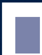
Isla 12 x 19 cm