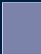
Página al corte 21,5 x 28 cm