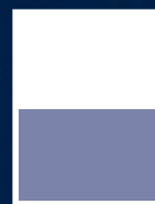
1/2 Página Horizontal 18 x 12,2 cm