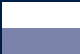
1/2 Doble Página Enfrentada 43 x 12,2 cm