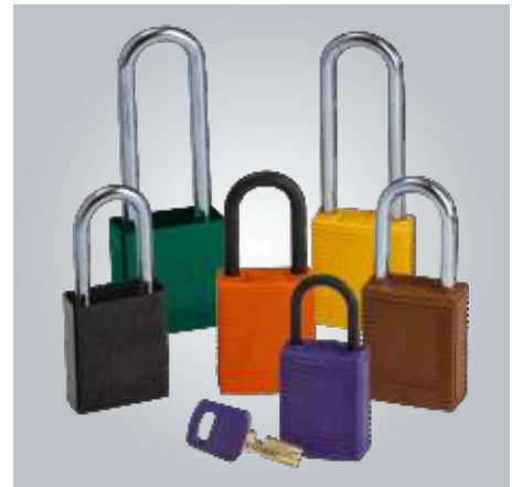
Hay nueve opciones de colores disponibles.