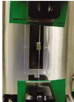
Imagen 2: Ensayo a Tensión de Filamento BarChip