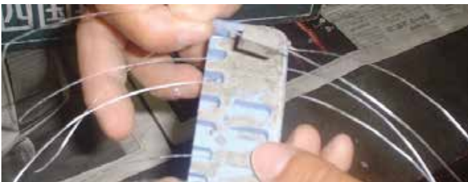
Imagen 1: Fibra BarChip encofrada en cemento.

En el intervalo requerido, los prismas fueron retirados del agua y probados. Se probaron diez (10) prismas en cada intervalo y se usó el promedio de los resultados.