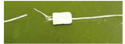
Imagen 3: Filamento BarChip después Ensayo.

Al acelerar las pruebas, es posible simular el rendimiento de BarChip en los años futuros. La prueba dio la duración en años donde 1 día = 90 días * equivalente a 60 grados de ambiente alcalino.