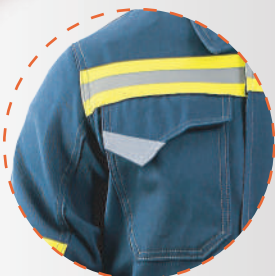
Bolsillo pectoral con tapeta y reflectante más velcro