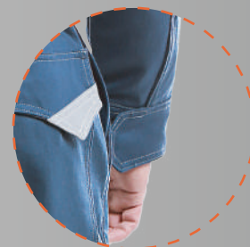
Ajuste en puño