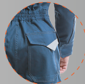
-Cinura elástica - Bolsillo trasero con reflectante más velcro