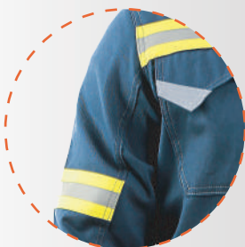
Cintas reflectantes en pecho, brazo, pierna y espalda