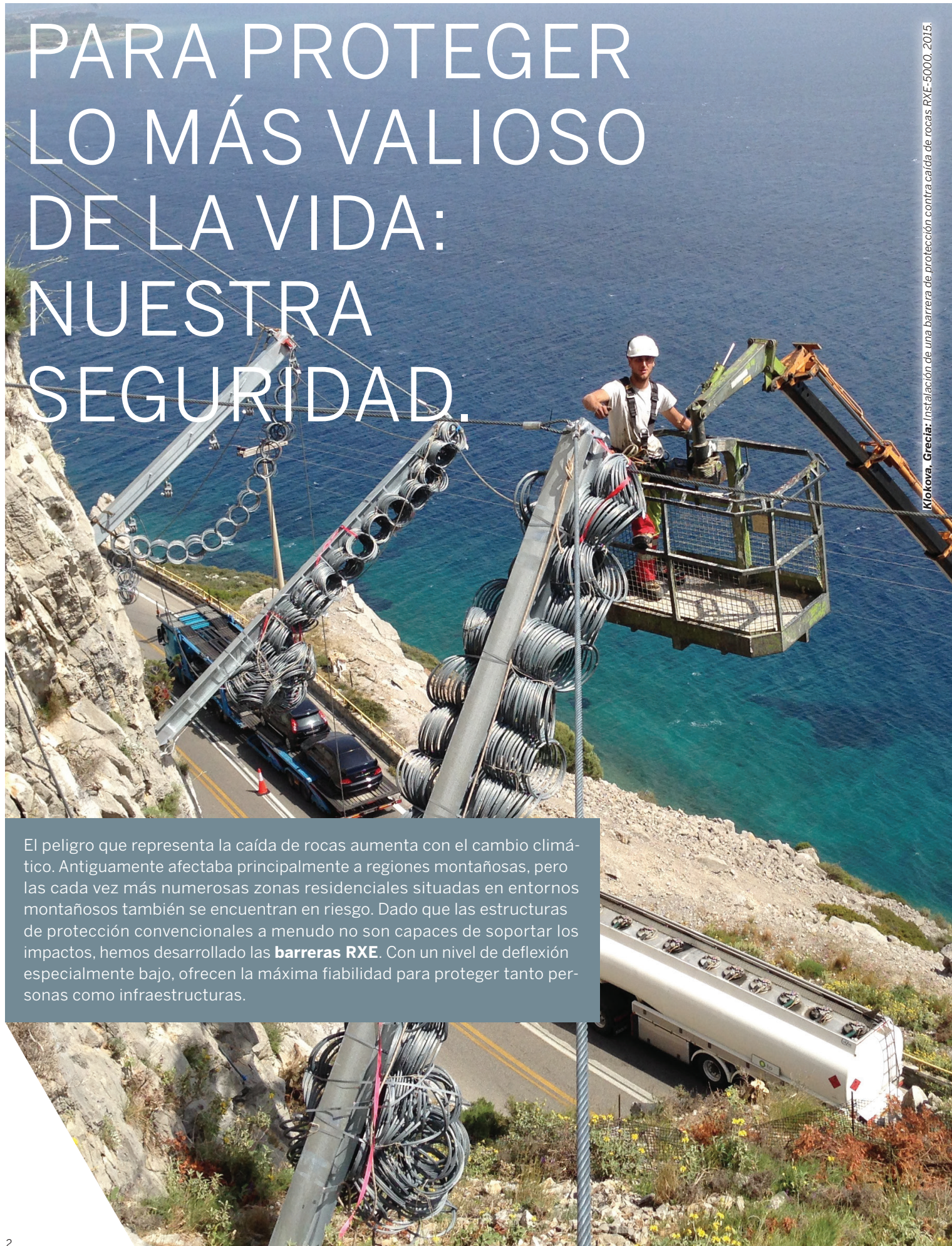
Klokova, Grecia: Instalación de una barrera de protección contra caída de rocas RXE-5000, 2015.

El peligro que representa la caída de rocas aumenta con el cambio climático. Antiguamente afectaba principalmente a regiones montañosas, pero las cada vez más numerosas zonas residenciales situadas en entornos montañosos también se encuentran en riesgo. Dado que las estructuras de protección convencionales a menudo no son capaces de soportar los impactos, hemos desarrollado las barreras RXE . Con un nivel de deflexión especialmente bajo, ofrecen la máxima fiabilidad para proteger tanto personas como infraestructuras.