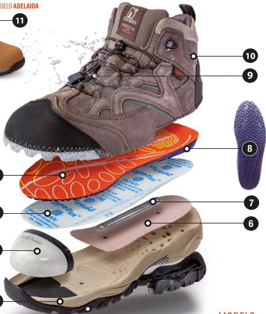
MODELO NEW ONTARIO