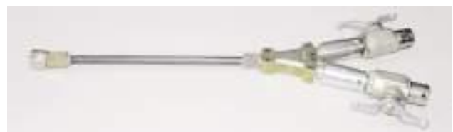
WEBAC® Mischkopf Steck-O