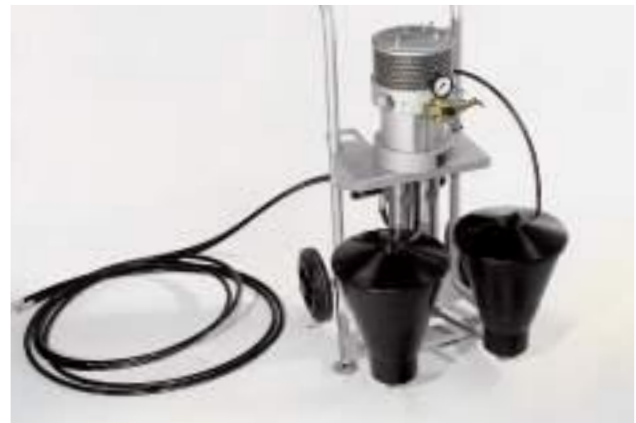
WEBAC® IP 2K-F2