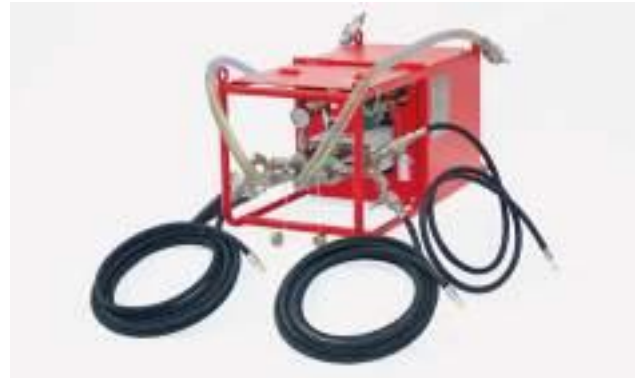
WEBAC® IP 2K-40

Bitte beachten Sie die Technischen Merkblätter zu den Produkten und Pumpen.