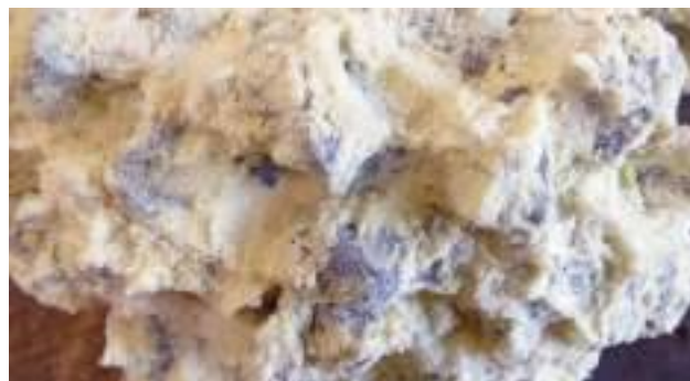
WEBAC® SILfill in Schotter