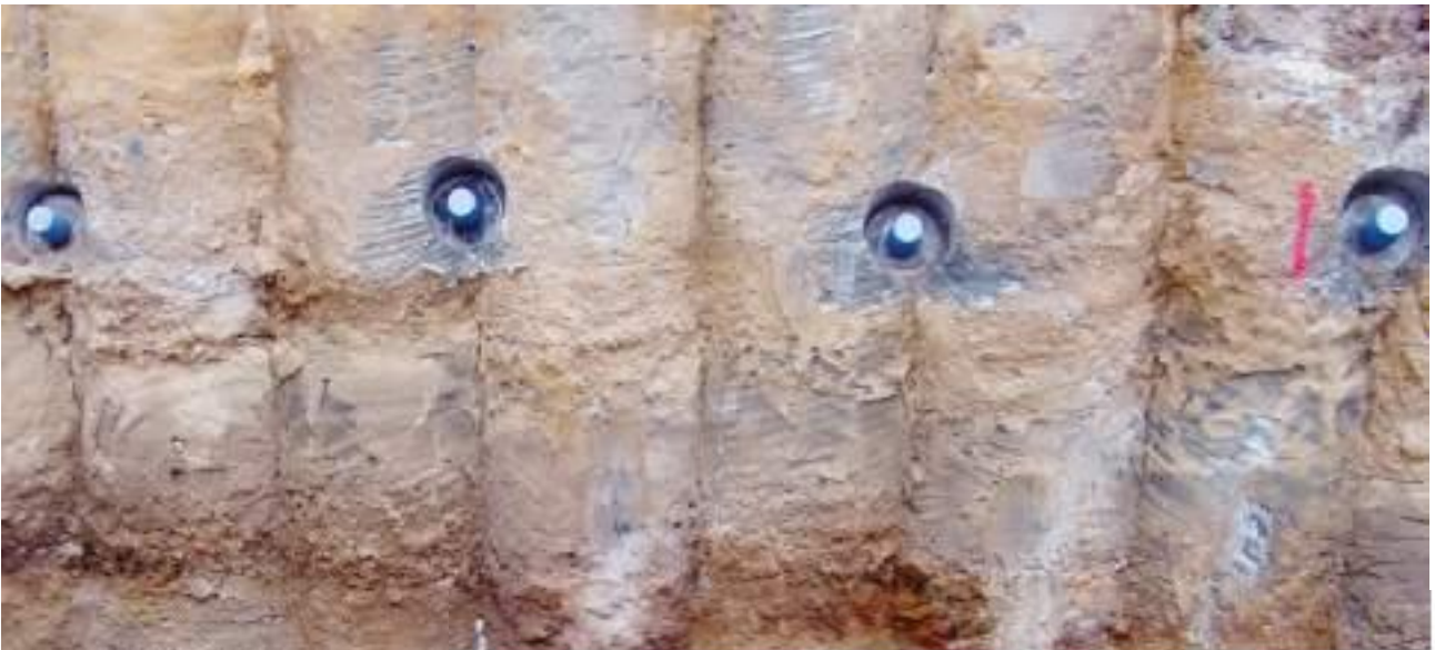
Abdichtung einer Bohrfahllwand

Die Harze sind alle im Mischungsverhältnis 1 : 1 VT zu verarbeiten, daher ist eine anwendungsfreundliche Injektion mit 2K-Pumpen möglich. Schneller und flexibler Einsatz durch kompakte Pumpentechnik und Gebindegrößen erhöhen die Wirtschaftlichkeit. Die Harze reagieren mit und ohne Wasserkontakt in kürzester Zeit aus und können somit frühzeitig voll belastet werden.