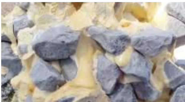
WEBAC® SILcompact in Schotter