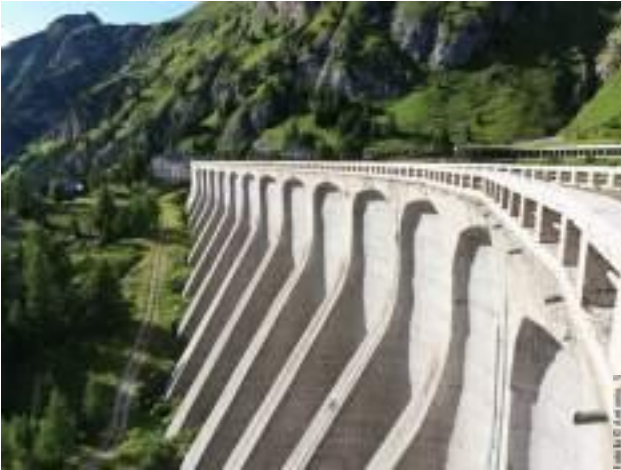
Passo Fedaia, Italien