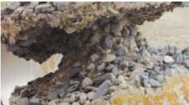
WEBAC® PURseal in Kies