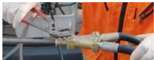
Montage WEBAC® Steck-O