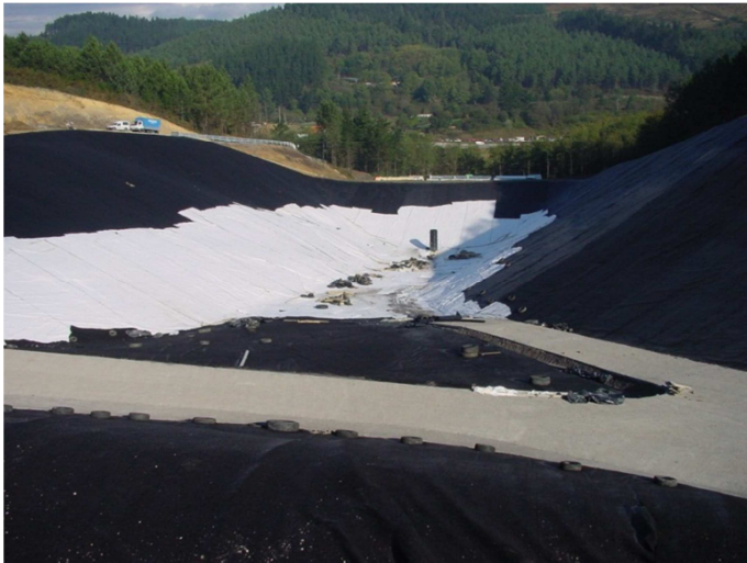
Figura 1 Ejemplo de obra con diferente exposición solar en función de la orientación del talud.

De hecho, según Grossman, al realizar el ensayo, tan solo variando la temperatura, la humedad o la longitud de onda de la lámpara UV los resultados pueden sufrir variaciones superiores al 500% (Grossman, 1993).