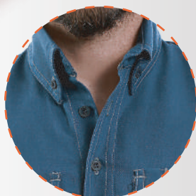
Botón en cuello