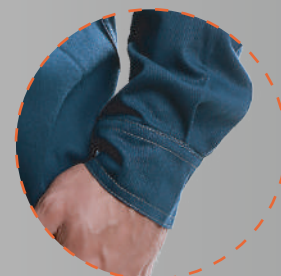
Puño con doble botón

LA LÍNEA UNISAFE 260 ES UNA PRENDA RETARDANTE A LA LLAMA CONTRA RIESGO DE QUEMADURA PRODUCIDA POR UN ARCO ELÉCTRICO. UNISAFE 260 OFRECE UNA MAYOR COMODIDAD Y MEJOR RESISTENCIA A LA PÉRDIDA DEL COLOR, ESTABILIDAD DEL TEJIDO Y DURABILIDAD.