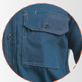
Bolsillo pectoral doble con tapeta