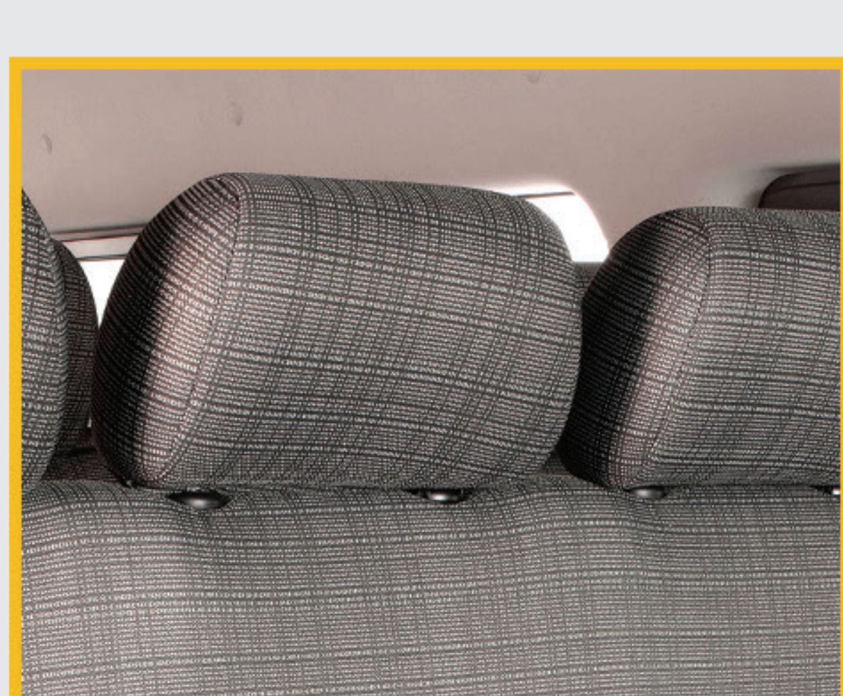
Asientos con apoya cabeza