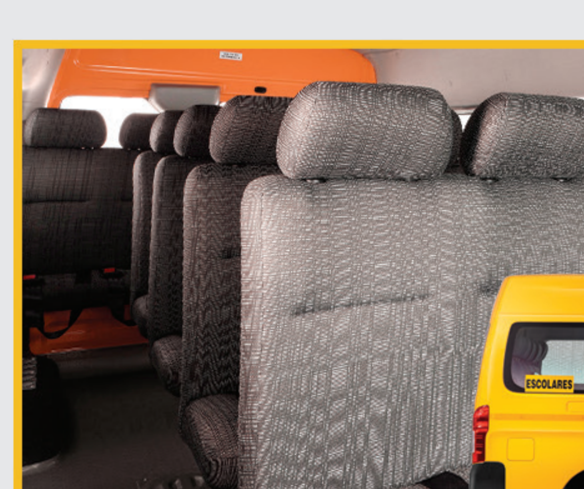
Capacidad 24 pasajeros