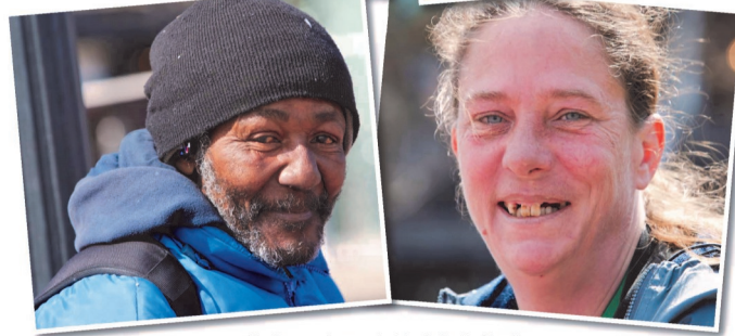
The Beacon is operated by Catholic Charities

The Beacon Homeless Day Resource Center Opening October 2017 - TheBeaconHelps.org