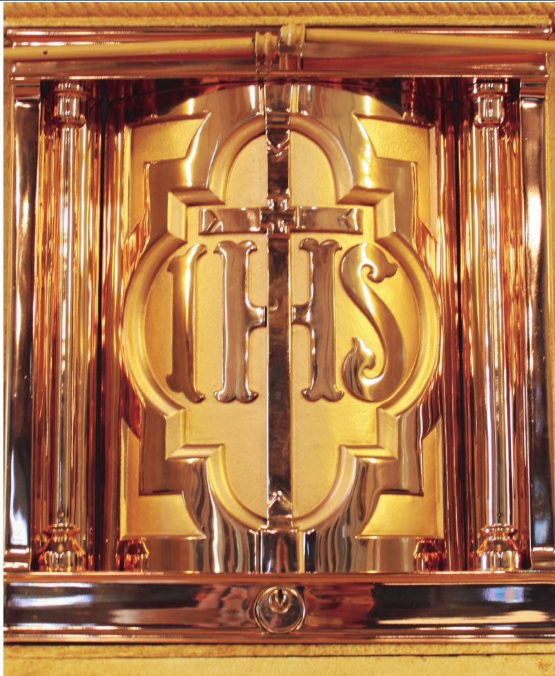
The month of August is dedicated to the Blessed Sacrament. Above is a photo of the beautiful tabernacle at Holy Redeemer Church.

Old St. Raphael Cathedral was destroyed by arson in 2005. Bishop Morlino has announced his intention to erect a new cathedral on the same site. In the meantime, an outdoor Way of the Cross is located there.