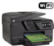
Multifuncional HP Jato de Tinta Officejet Pro 276DW Printer

Por: R$ 1.199,00 ou 10X de R$ 119,90 sem juros