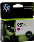
Cartucho de Tinta HP OfficeJet 951XL Magenta - CN047AB

Por: R$ 100,90 ou 5X de R$ 20,18 sem juros