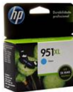
Cartucho de Tinta HP OfficeJet 951XL Ciano - CN046AB

Por: R$ 100,90 ou 5X de R$ 20,18 sem juros