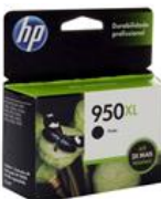
Cartucho de Tinta HP OfficeJet 950XL Preto - CN045AB

Por: R$ 134,90 ou 6X de R$ 22,48 sem juros