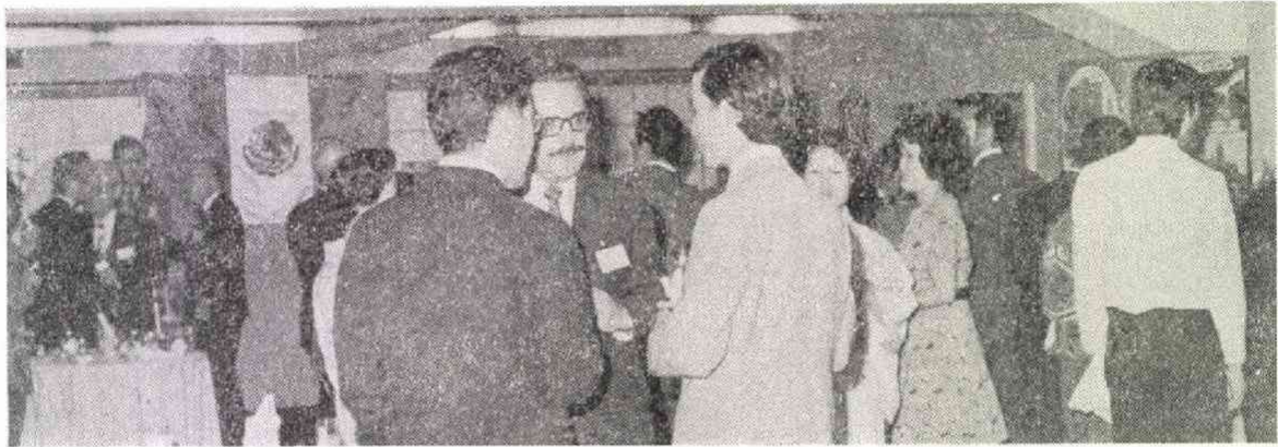
マリアッチとメキシカン・コーヒーの香り流れる会場