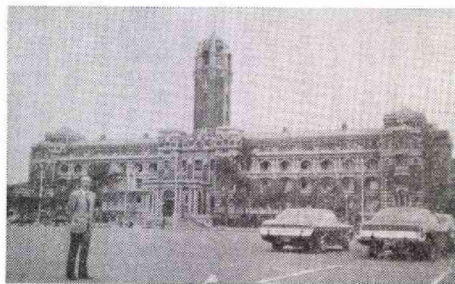
台湾・行政院前に立つ黒木会員

ちなみに、一九七九年、ピーク時の日本人観光客の六九万三、六七一人も年々減り、昨年は四九万八、一八八人。減つた分は買春ツアー族とか。もつて銘すべし。