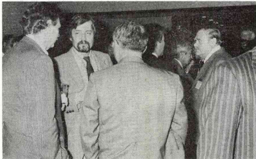
⇒ 左から外人記者クラブのレインゴールド会長(タイム)とバイル第一副会長(AP)