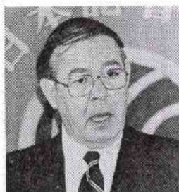
クローセン世銀総裁