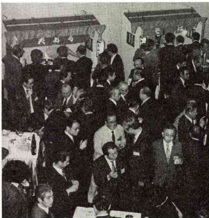
合 天ぷら、そば、寿司の屋台が好評で、身