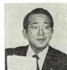
船盛京都セラミック社長