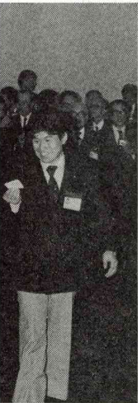
● 等のポータブルタイプ(Fジャパン) —