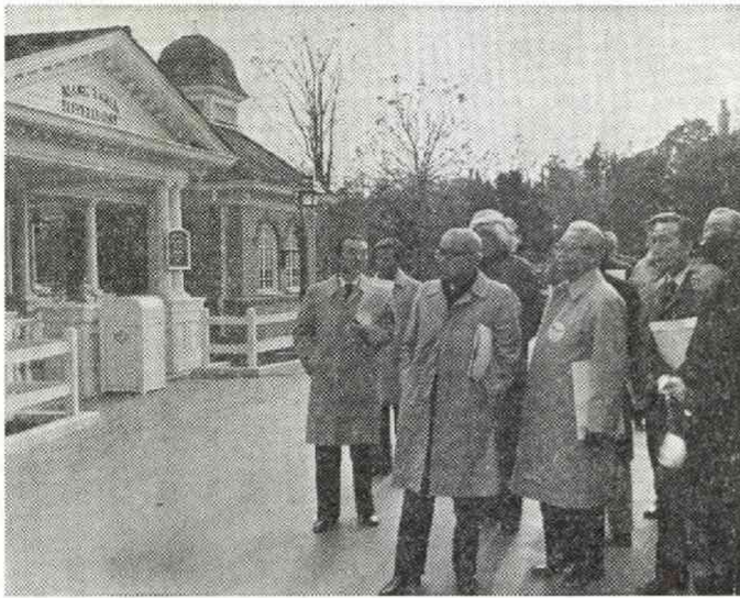
東京ディズニーランド見学会 (10日 参加 100名)