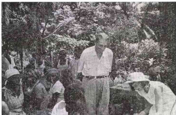
治療ぶりをみるシュバイツァー博士

るマスコミざらいで、ヨーロッパの記者たちは病院まで出かけていって、は支那払いを食っている。私は博士との会見の約束をとりつけるため、まずコンゴ河をへだてたベルギー領のレオポルドビル（現キンシャサ）に入り、手紙で訪問したい旨を伝え「お返事を当地でお待ちします」と結んだ。