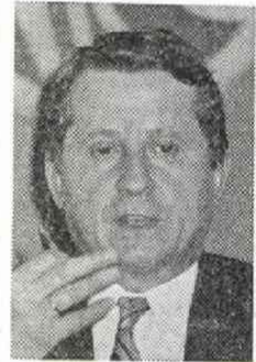
ヤーノシュ・ベレツ

柔軟に現実を吟味し、創造的社会主义政策を進め、東側でもユニークな経済政策を採用、実施しているハンガリー。近い将来に党中央書記局、政治局入りも確実と見られている、ヤーノシュ・ベレツ氏（党中央委員）は、きわめて明解にその社会主義の原則と政策について語った。