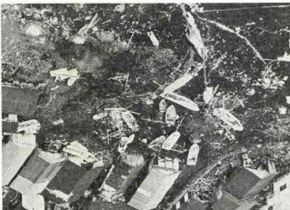
津波に襲われた秋田県八森漁港 (5月26日午後3時)

古文書を見ると、秋田県にも津波が押し寄せた記録はある。三十九年の新潟地震でも、潮位が一メートル以上上がった、と記録されている。あるいは「大地が裂け、どす黒い水柱が噴き上がった」などと、液状化現象そのものの記述も無数にある。これら