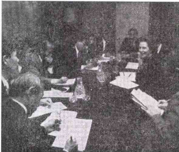
英首相官邸での日本人特派員との会見 (昨年9月14日)

ャー政権は、大手広告会社「サATCH・アンド・サATCH」にPR活動を依頼したし、今回の選挙戦では、ベテラン・ジャーナリストを広報担当参謀に引き抜いて、「一般のマスコミを超えた次元で、的確に国民の心理をつかんでほしい」と指示した。米国式に映ろうが、サッチャー首相は、日本も含めて、時代の先端をゆく制度や方式をひそかに英国に導入し始めたのである。 当然のことだが、特派員はまずまず勉強を要請せよし、何より日本人としての明確な視点を備えなくてはならない。