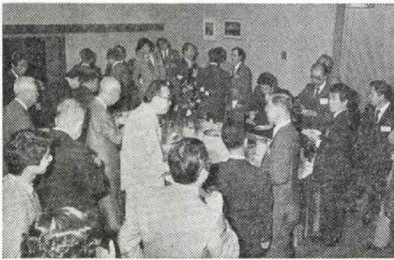
中国の新聞研究学者代表団の歓迎レセプション(19日)