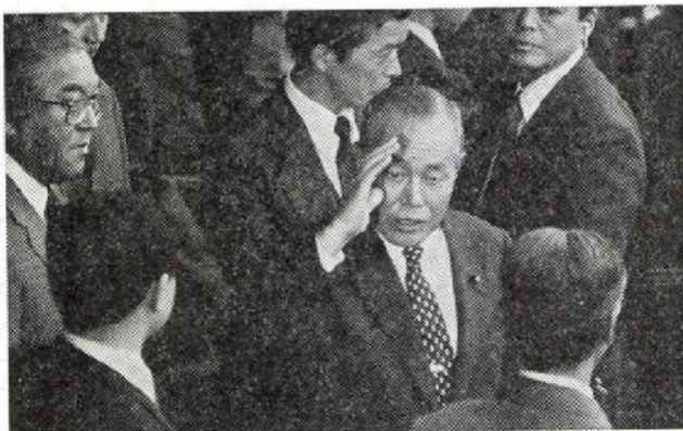
実刑判決を受け、保釈金3億円を納めて地裁を出る田中被告

午後二時過ぎ、田中元首相は三億円の保釈金を積んで地裁をあとにした。元首相の車を無線カー、オートバイ、ヘリコプターが追った。その喧噪を耳にしなが、夕刊のゲラ刷りがファックスを通して記者室に送られてきた。「10・12判決」報道大作戦は終わった。