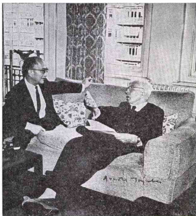
トインビー博士(右)と筆者。右下にトインビー氏のサイン。

うか。日記をつけていなかったのが惜しまれるけれども、一問一答で紙面に載ったもの、雑談風に聞いたことを記事に使わせていただいたものなど、黄色くなったスクラップ・ブックをながめながら、随分いろんなことを、失礼にもきいたものだ、いまは思う。