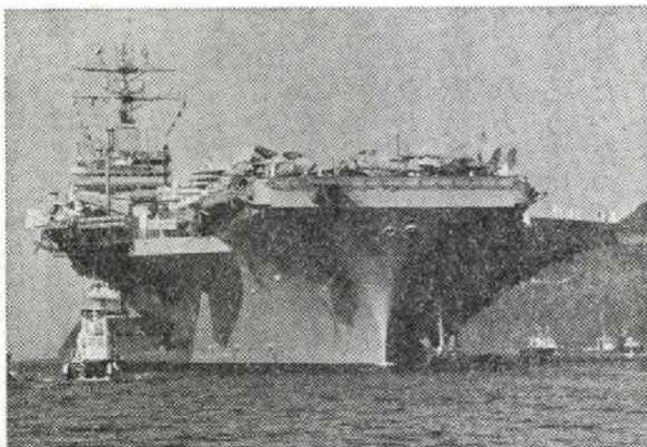
佐世保港に停泊中のカールビンソン

ところで最近目立つのは、米国の核は自由のためで戦争の抑止力、ソ連の核は侵略的という意見。原水禁大会が分裂する原因になった論理の裏返しだ。核兵器に『よい核、悪い核』があるはずはない。被爆原紙の記者がカールビンソン寄港で痛感したのは、政府や闘争のリーダー達も含めて、日本全体が核軍縮など具体的な平和への取り組み、努力が足りないという事だった。