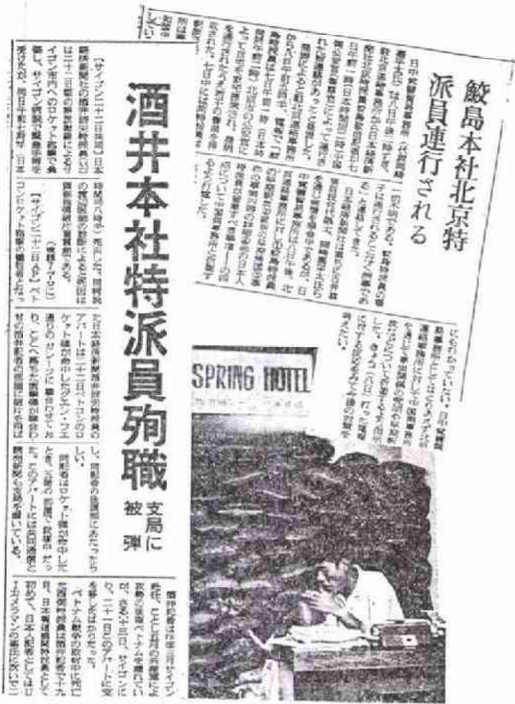
鯨島記者連行、酒井記者殉職を報じる日本経済新聞 (43. 6. 9と8.22)

「部長、大変です。酒井君がロケット弾でやられました。重傷のようです」 デスタは永田長君（現日経マグロービル常務）だったが、どだい外報部からの早朝の社電は悪いことと決まっている。当