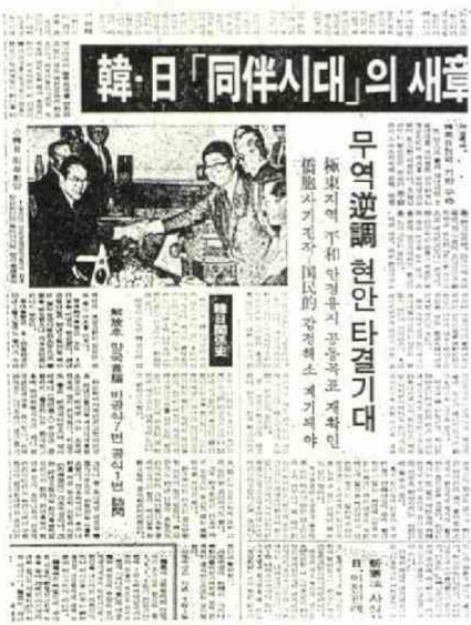
安倍・李源京の外相会談を報じる朝鮮日報 (7月8日)

多くは、独立後に民族教育を受けた植民地時代を知らない「ハンゲル世代」であるという。「日本から学ぶことは多い」「歴史の責任は被害者の側にもある」と、自ら言うほどの自信と余裕をこの世代は持ち始めたということになる。 全大統領の訪日を七月上旬に初めて報じた韓国のマスコミは、この韓国内の意見の対立には全く触れず、「日韓新時代」と「過去にこだわり続けるよりも、未来の建設を」などと強調した。韓国国民は日本の歴史の清算の仕方と、全斗煥大統領訪日後の日本の朝鮮半島外交の行方に関心を寄せている。 (しげむら としみつ 毎日新聞ソウル特派員)