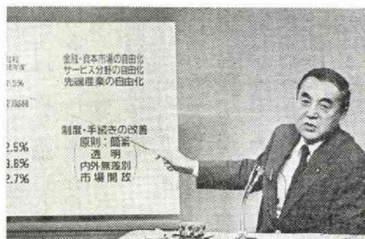
首相の「独走」に、後で内閣記者会から抗議も出たが、パネルを使つての異例の総理会見は概して外人記者には好評だった（4月9日）