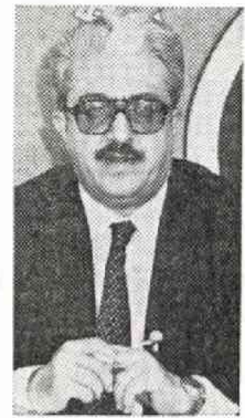
T・アジズ イラク副首相兼外相

専用機でニューヨーク、モスクワを回り東京へ。外相は昨年五月安倍外相とともにクラブで会見した。今度は一人で。