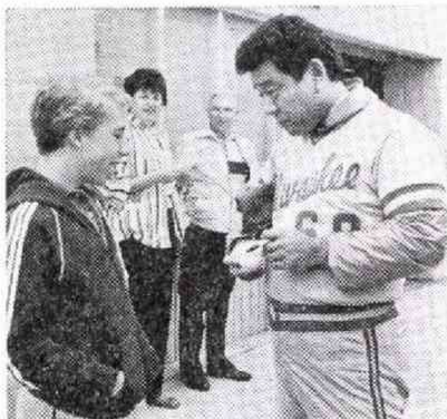
キャンプ初日、地元の少年の求めに応じアメリカで初のサインを