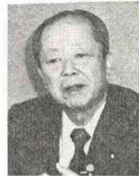
自由民主党総務会長 宮 沢 喜 一

以前からお招きをいただいていたのでございますけれども、あまりお役に立つようなことは申しあげられないような気がいたして、何となく遠慮しておりました。決して不遜な意味ではなかったものであります。今週は大変ヘビウエートの方々が(十一月二十八日中曾根首相、同三十日ガンジーインド首相)おいでになるそうでございますので、ライトウエートも一人ぐらいいいかと思つて参上いたしました。