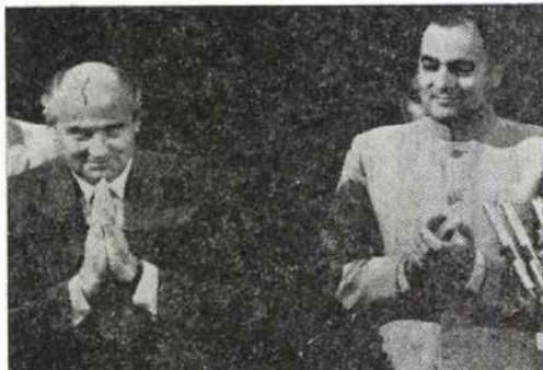
国会でのスピーチでは米国の「スターウォーズ」計画を批判したゴ書記長(11月27日)