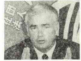
F・H・ムルコフスキー米上院議員 アラスカ州選出、上院外交委員 東アジア・太平洋問題小委員長 で、共和党国際通商問題作業部 会長を務める。

成田から大阪へ直行、日曜日荒れた海へ出て、関西新空港の建設予定地を見てきた。「このプロジェクトは、米企業の参加が閉ざされているということを示す象徴になっている」。貿易インバランスの推移、日米交渉の経緯、予定される日本の巨大公共プロジェクトなどを整理した大きなパネルを、何枚も持参しての会見となった。