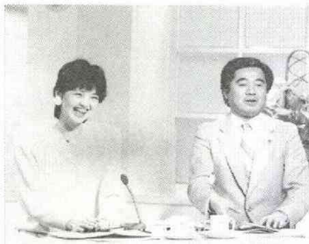
ダジャレもとび出す楽しいおしゃべりも人気の秘密

番組一回の放送で約五十人の人々が登場する。本社一階のロビーに張られた番組のポスターには「フツッの人が出るテレビ」とあった。（河野 聡）