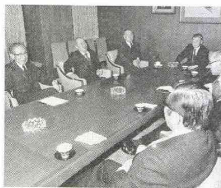
緊急首脳会議で「税制改革は既定方針通り進める」と決めたが…… (3.19)

だが、こうした表面静かな時に、政局への仕掛けがつけられる。かくて、夜討ち朝駆けは続く。