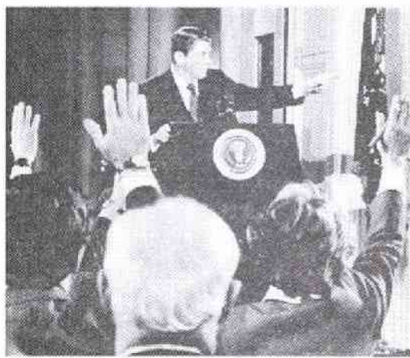
4か月ぶりの記者会見——質問の3分の2はイラン・ニカラグア事件に集中した(3.19)

三大テレビの記者へは、シャウティンク・クエスチョンを放映すると必ず視聴者から「大統領にどのような質問するのは失礼だ」との苦情電話がかかってくる。オープンな米国社会でも、シャウティンク・クエスチョンは「行儀の悪い行為」なのだ。イラン・スキヤンダル発覚後は