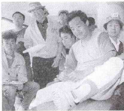
マンマリの落合選手を見守る記者たち

かしわ ひでき（一九六四年報知新聞入社、アマスポーツ、オンラインピク取材などを経て、現在巨人担当）