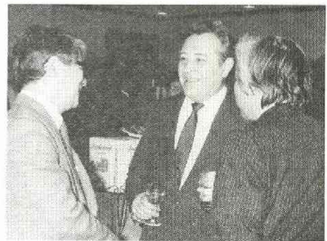
ソロビコフ駐日ソ連大使も出席——ソ連・東欧記者会総会 (3.18)

三月の例会は二十八日(土)。二十三人の総対局数は四十二局。吉沢正也六段は前月と同じ四勝一敗、赤井良平五段は一月から六連勝、塚本初段は昨年十二月、今年一月に続いて三たび三勝一敗(通算九勝三敗で昇段間近?)久々に登場の山田健吉二段が三勝一敗、斎藤吉史三段四勝三敗、の各氏が今月の優秀賞。初参加の広田耕司初段(日経)は三勝二敗の好成績であった。