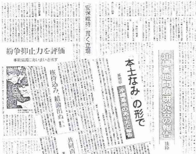
「本土並み、1972年返還」報告を報じる朝日朝刊(1969年3月9日付)

た専門記者制度の第一号として、編集委員になっていた(安保調査会研究員を兼務)。この研究会への仲間入り、自由な記者活動の差し支えになることはないかという問題がある。だが所詮、独立性の確保は、自分自身のその都度の態度で決まるのだ、と割り切った。 「沖繩基地問題研究会(久住忠男座長)」は正式には一九六八年二月に発足した。メンバーは十四